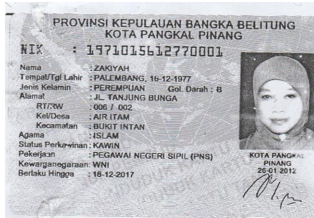
Lampiran B-1 Data Pemohon