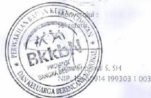
Lampiran B – 2 Penerimaan Barang

Yeny Anggraini, SE NIP. 19820123 200802 2 001