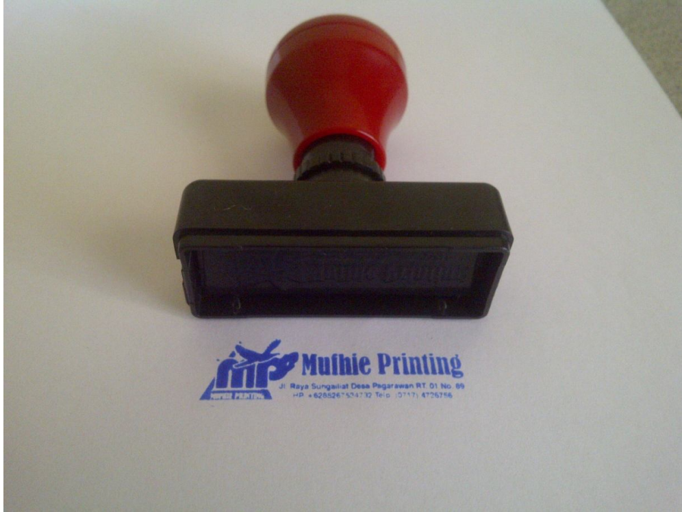
Lampiran – A5 Stempel