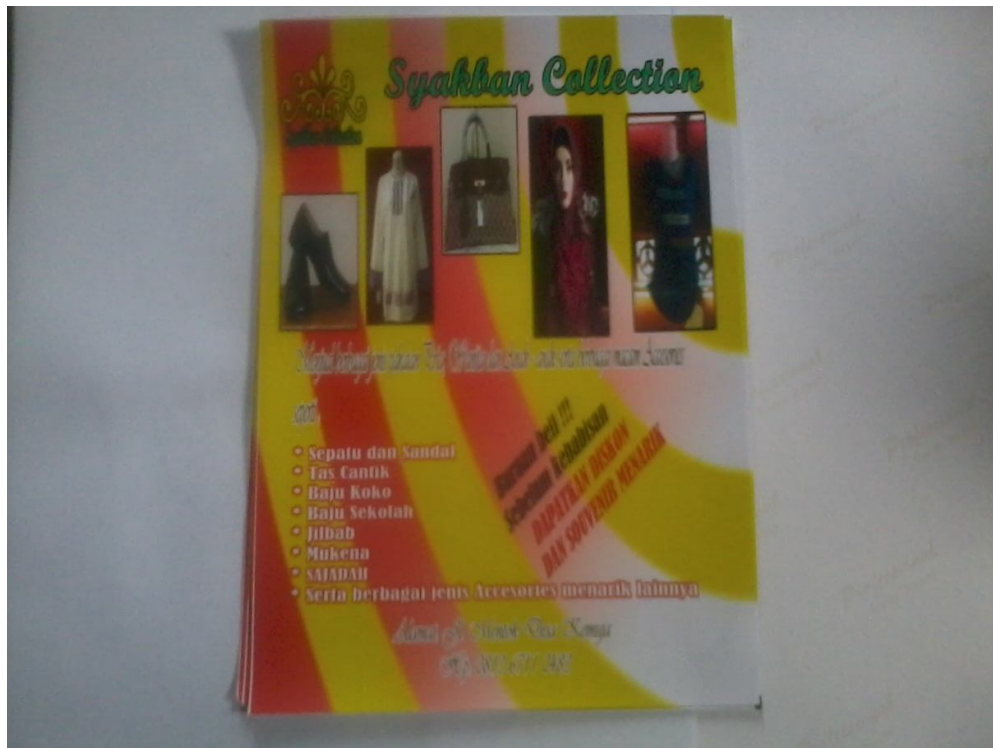
Lampiran Foto A.10