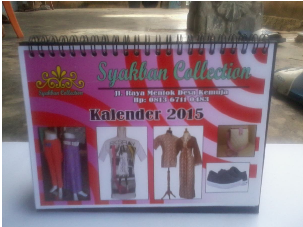
Lampiran Foto A.4