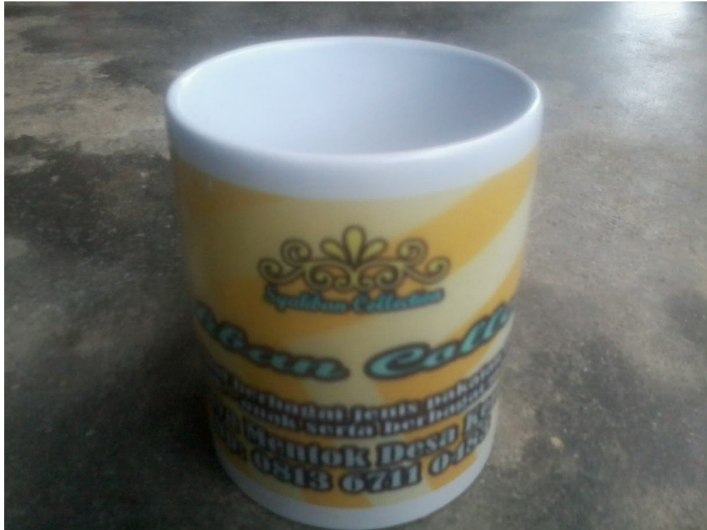
Lampiran Foto A.8