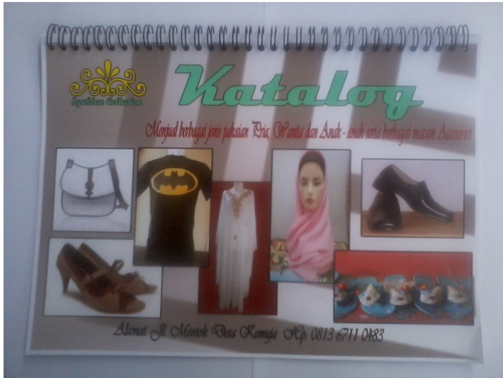
Lampiran Foto A.1