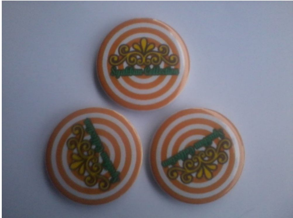
Lampiran Foto A.9 Photo Hasil Cetak Pin