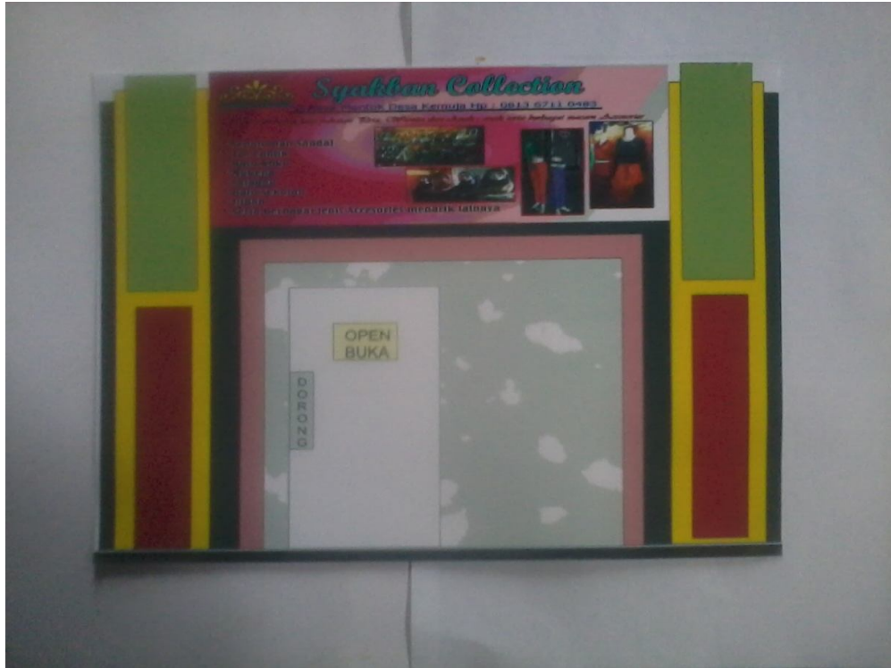
Lampiran Foto A.3