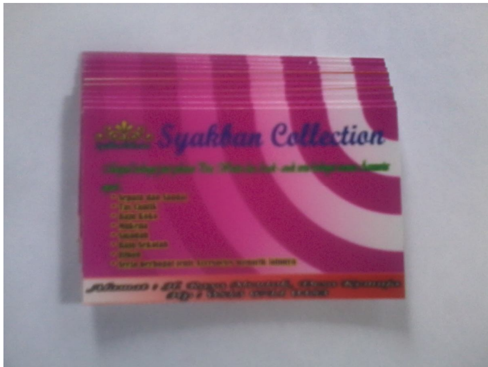
Lampiran Foto A.7