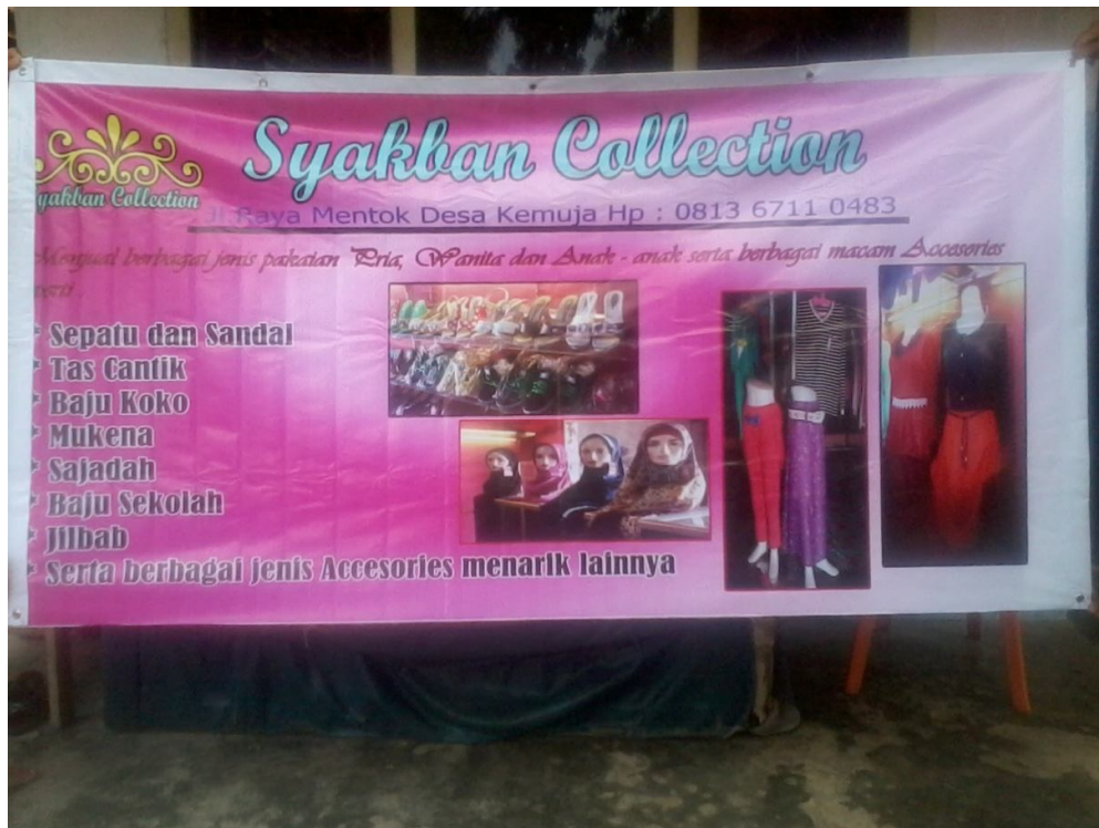
Lampiran Foto A.6