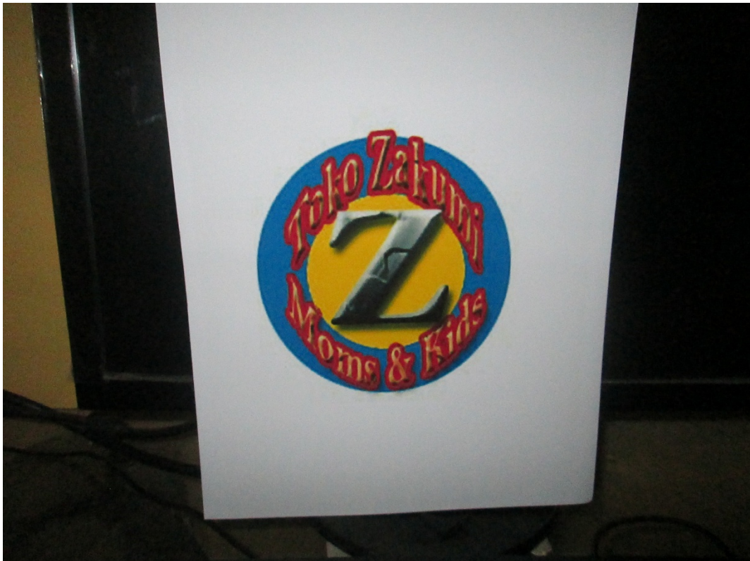
Lampiran Foto Stationary Logo Zakumi moms & kids