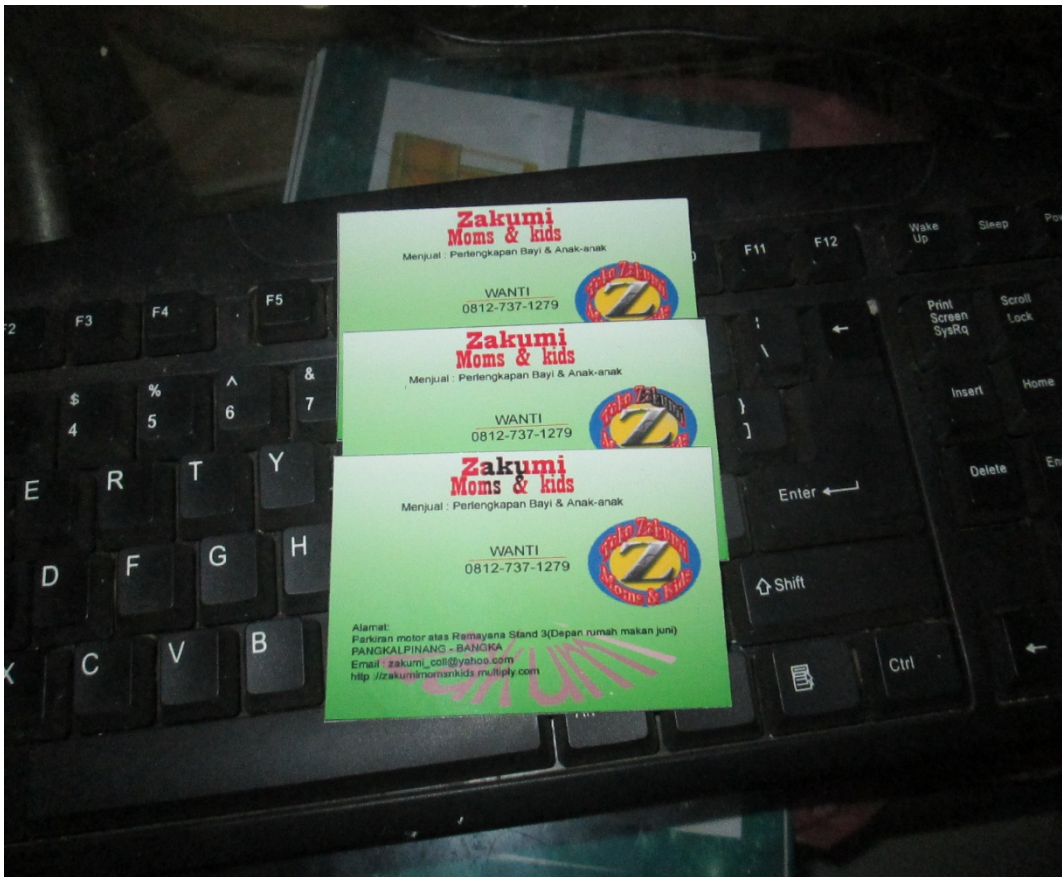
Lampiran Foto Kartu Nama Zakumi moms & kids