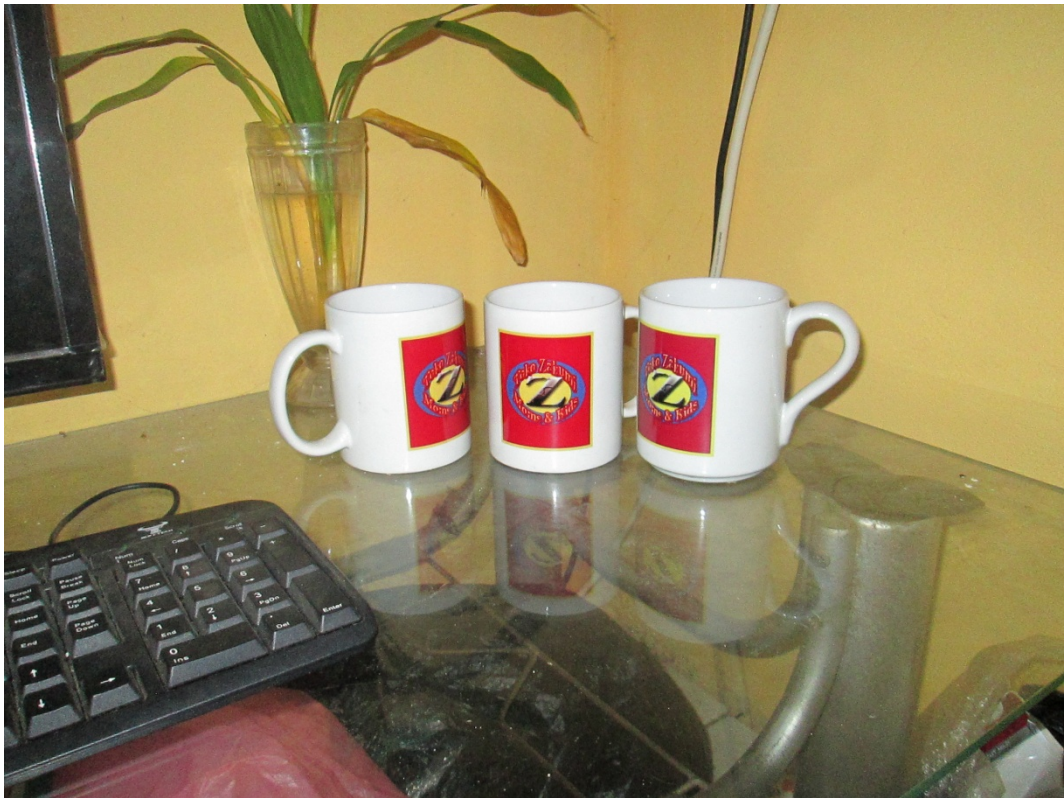
Lampiran Foto Stationary Mug Zakumi moms & kids