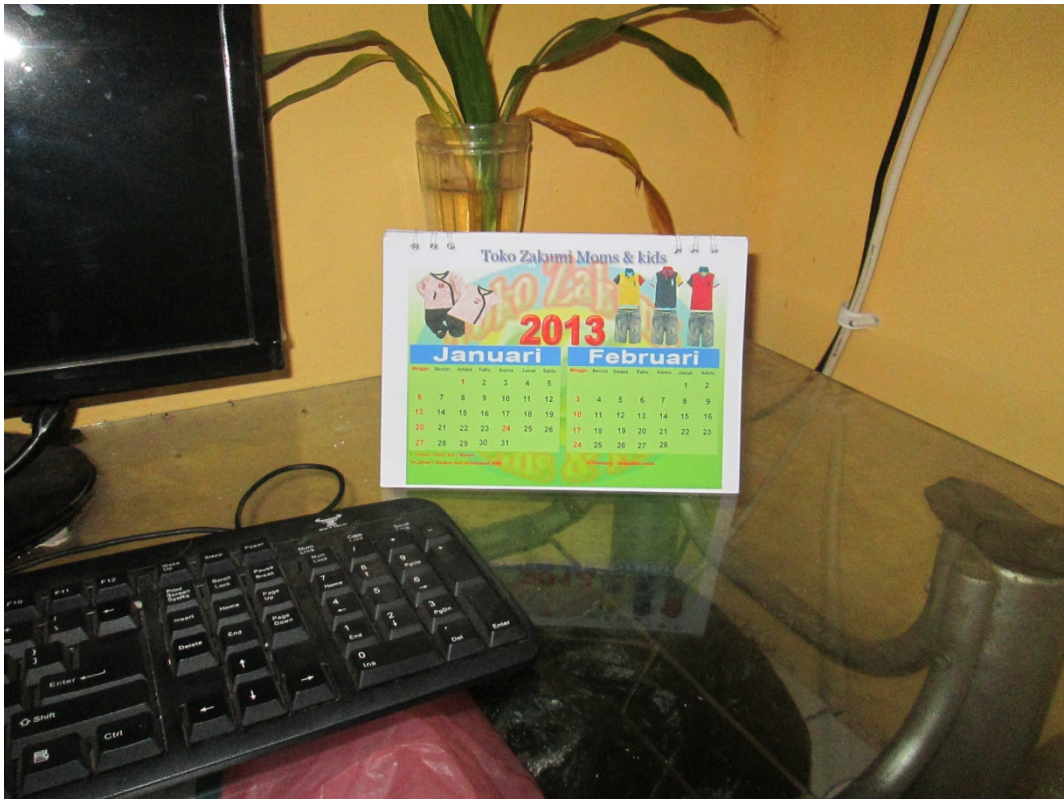
Lampiran Foto Stationary Kalender Zakumi moms & kids