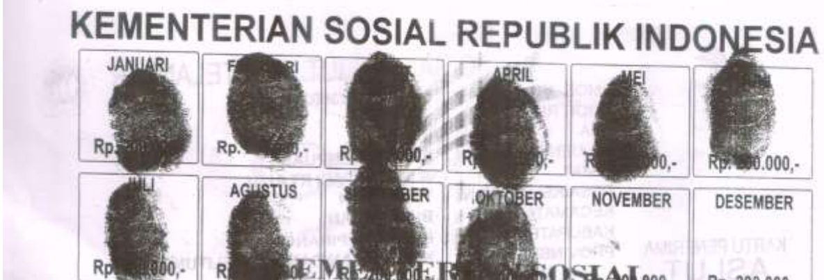
Lampiran A.2 : Kartu Penerima ASLUT( Tampak Belakang)