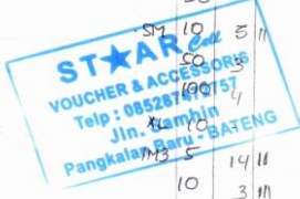
Lampiran A - 2