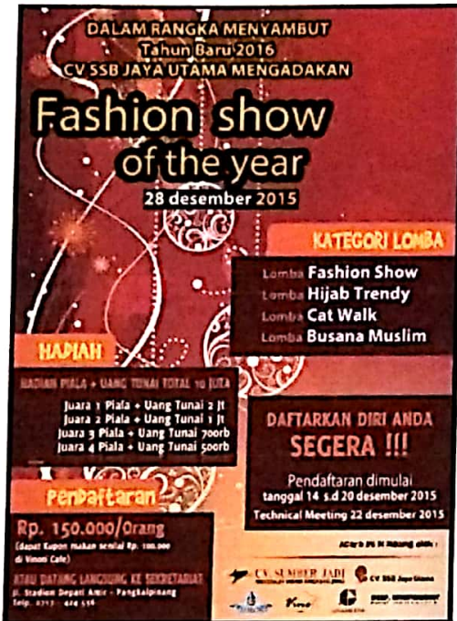
Gambar IV.4 Isi Keterangan Brosur

Pada proses ini kita akan mengisi data pada latar belakang yang telah dibuat sesuai dengan keterangan yang telah di berikan oleh pelanggan .