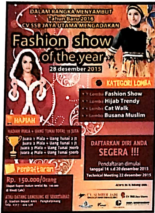
Gambar IV.6 Finishing Desain brosur

Pada bagian ini kita hanya perlu melakukan sentuhan akhir dengan menambahkan hiasan ataupun gambar pendukung untuk memperbagus hasil desain kita.