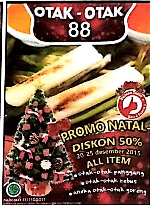
Gambar IV.7 Finishing Desain Poster