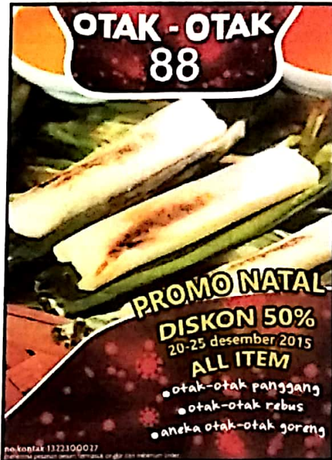
Gambar IV.5 Isi Keterangan Poster