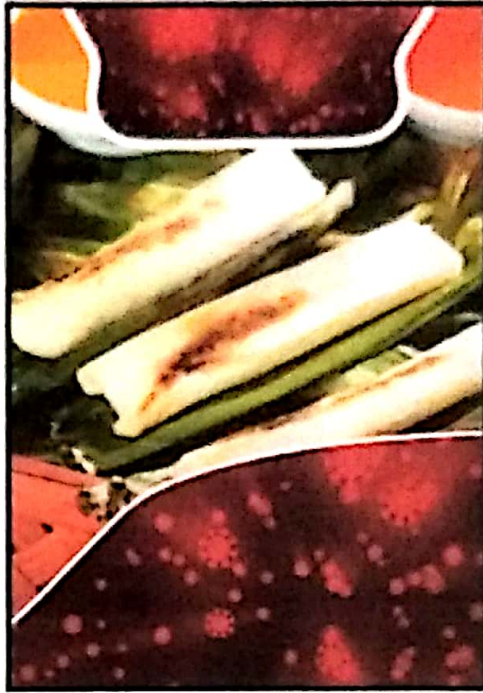
Gambar IV.3 Latar Belakang Poster