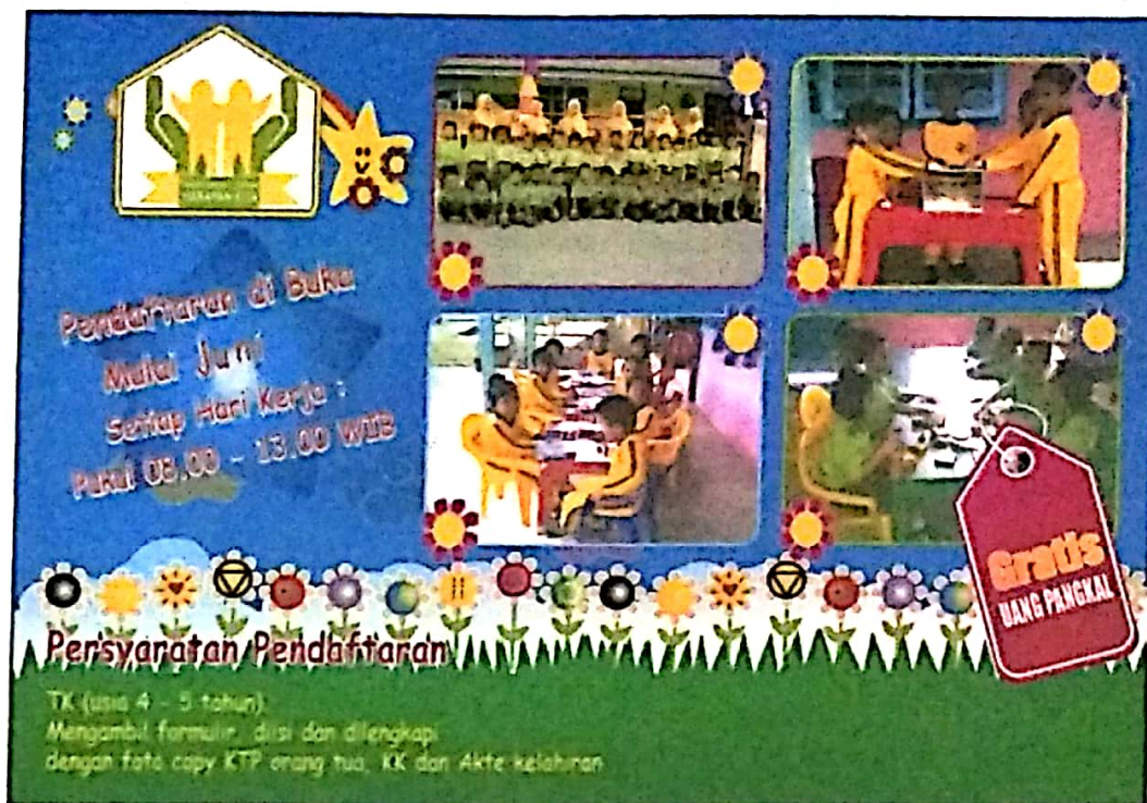
Gambar IV.5 Cover dan Isi Brosur