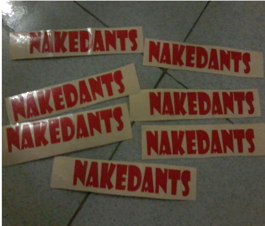
Lampiran A-6 Sticker