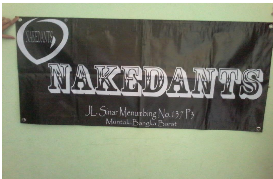
Lampiran A-5 Spanduk