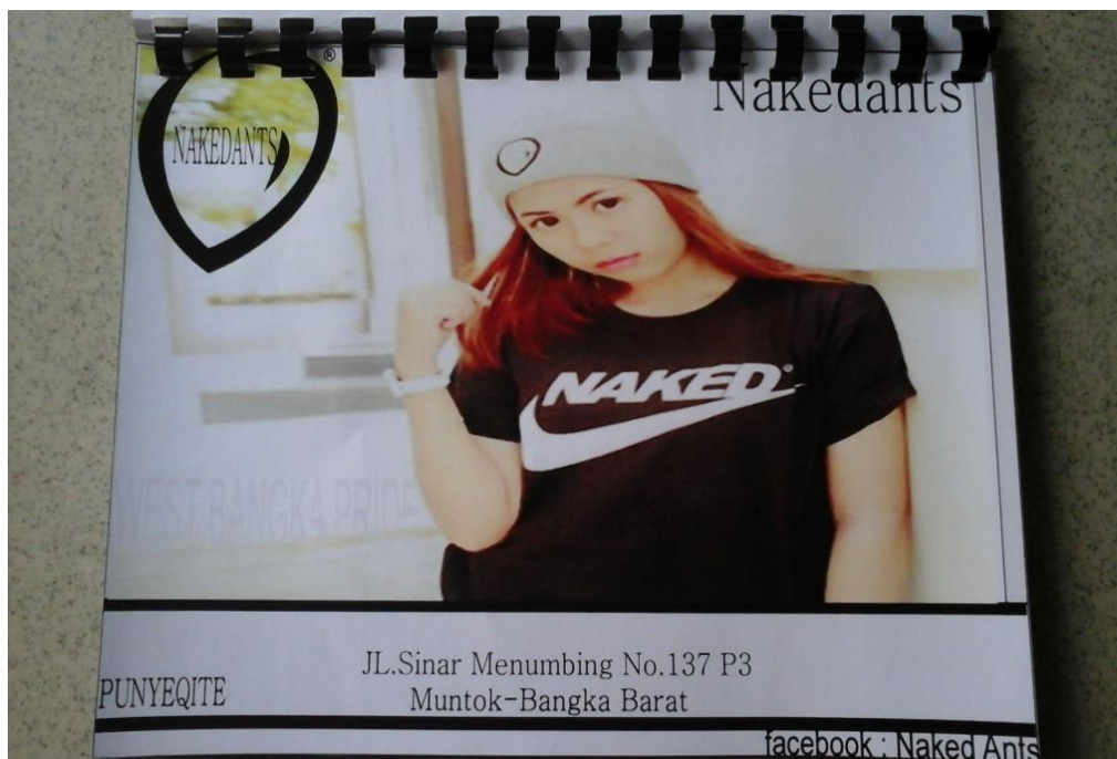
Lampiran A-1 Katalog Distro Nakedants