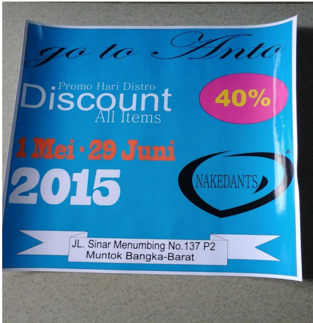
Lampiran A-3 Brosur