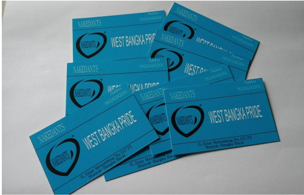
Lampiran A-2 Kartu Nama