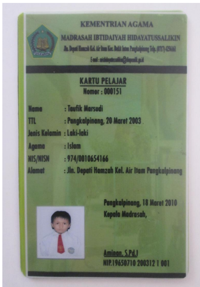
Lampiran A-10 Hasil Cetak Stationary Kartu Pelajar