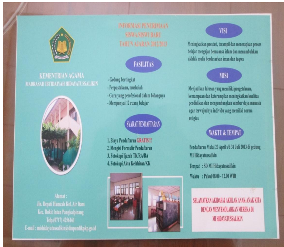
Lampiran A-6 Hasil Cetak Stationery Brosur