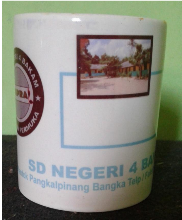
Lampiran A-5 Hasil Cetak Stationary Mug