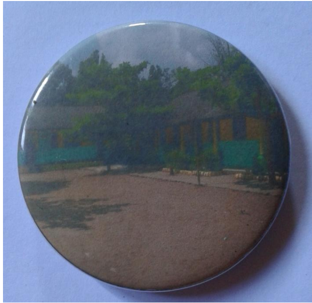
Lampiran A-11 Hasil Cetak Stationary Pin