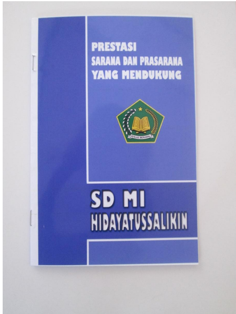
Lampiran A-1 Hasil Cetak Majalah