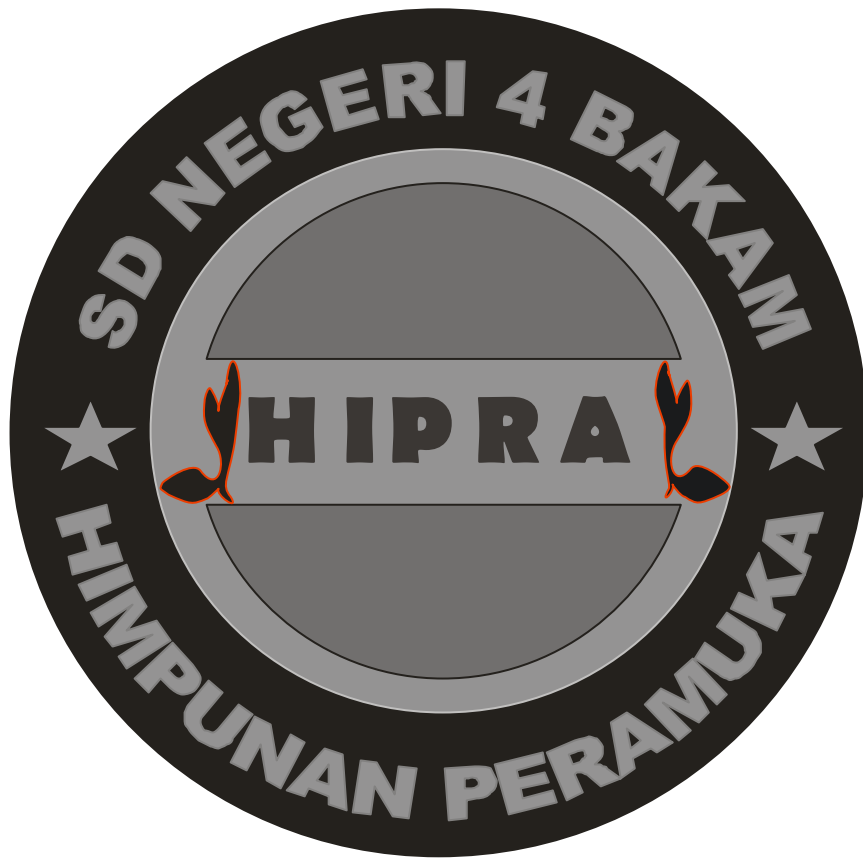
Lampiran A-2 Hasil Cetak Logo