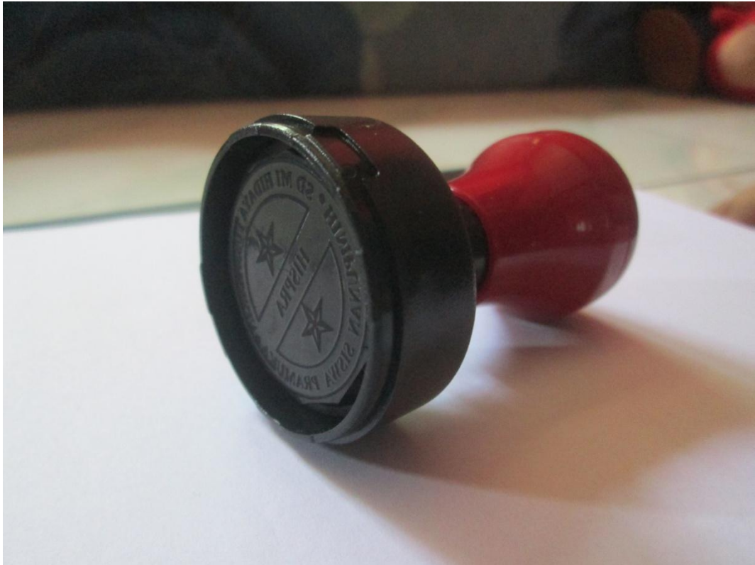
Lampiran A-9 Hasil Cetak Stationary Stempel