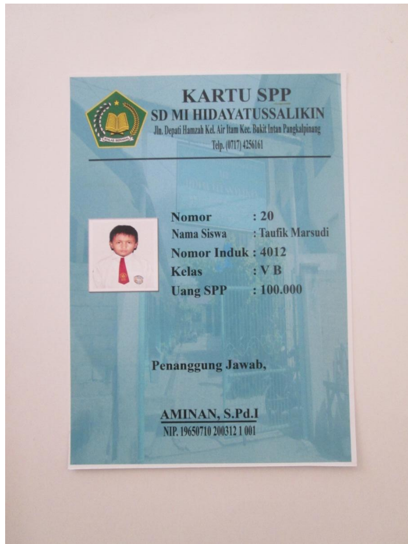
Lampiran A-7 Hasil Cetak Stationary Kartu SPP