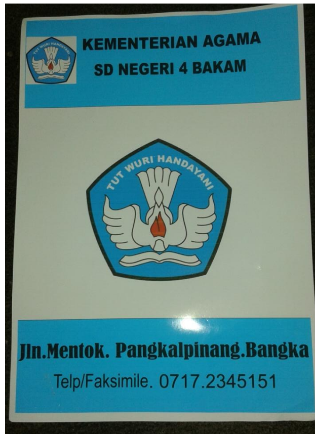
Lampiran A-8 Hasil Cetak Stationary Kop Surat