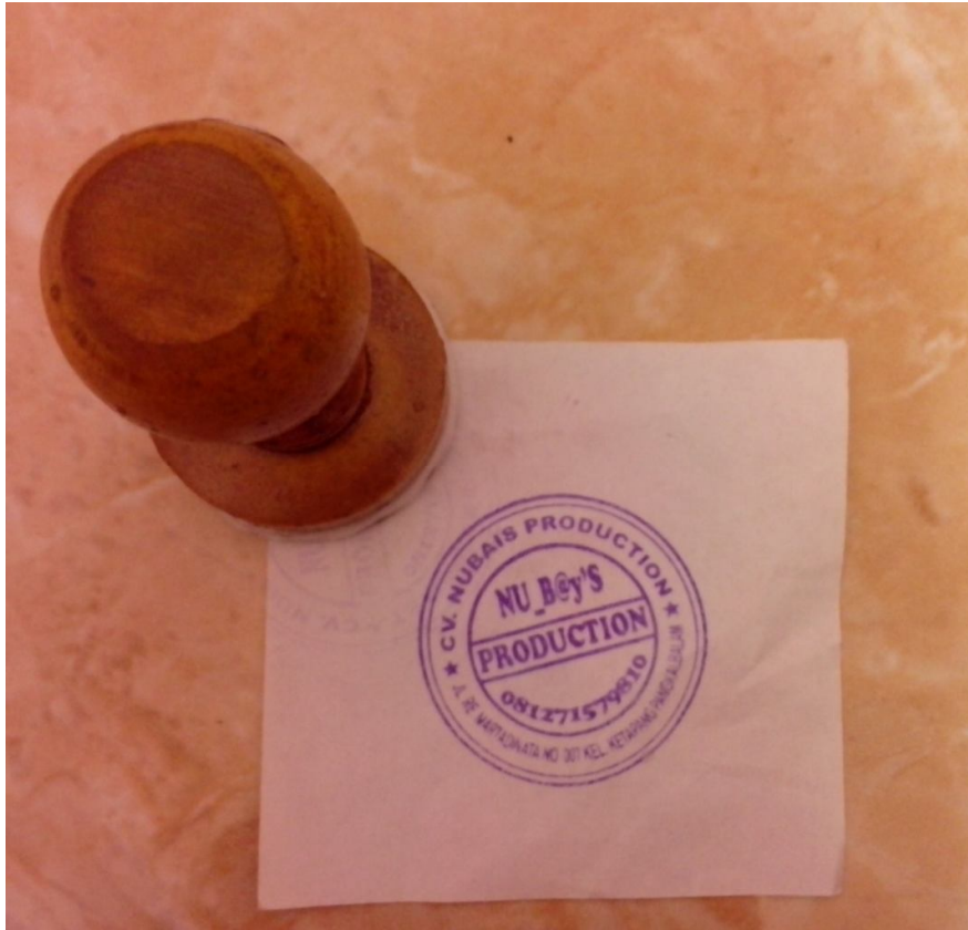
Lampiran A-7 Stempel