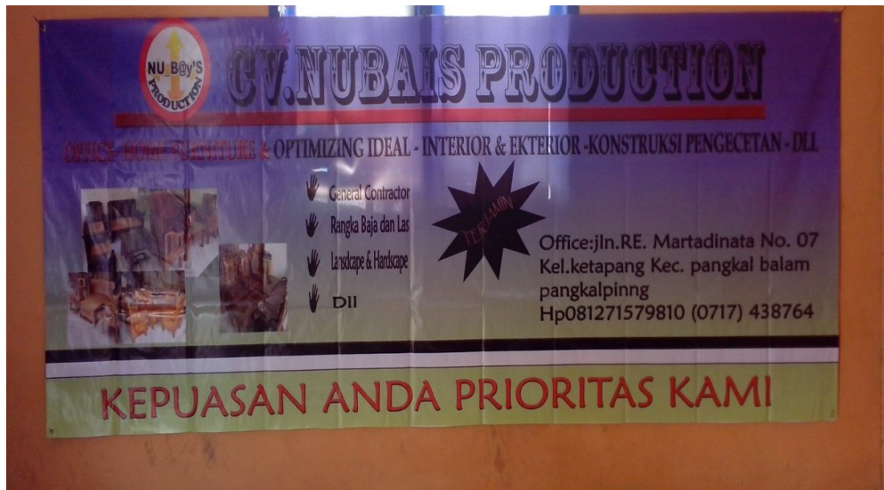
Lampiran A-2 Spanduk