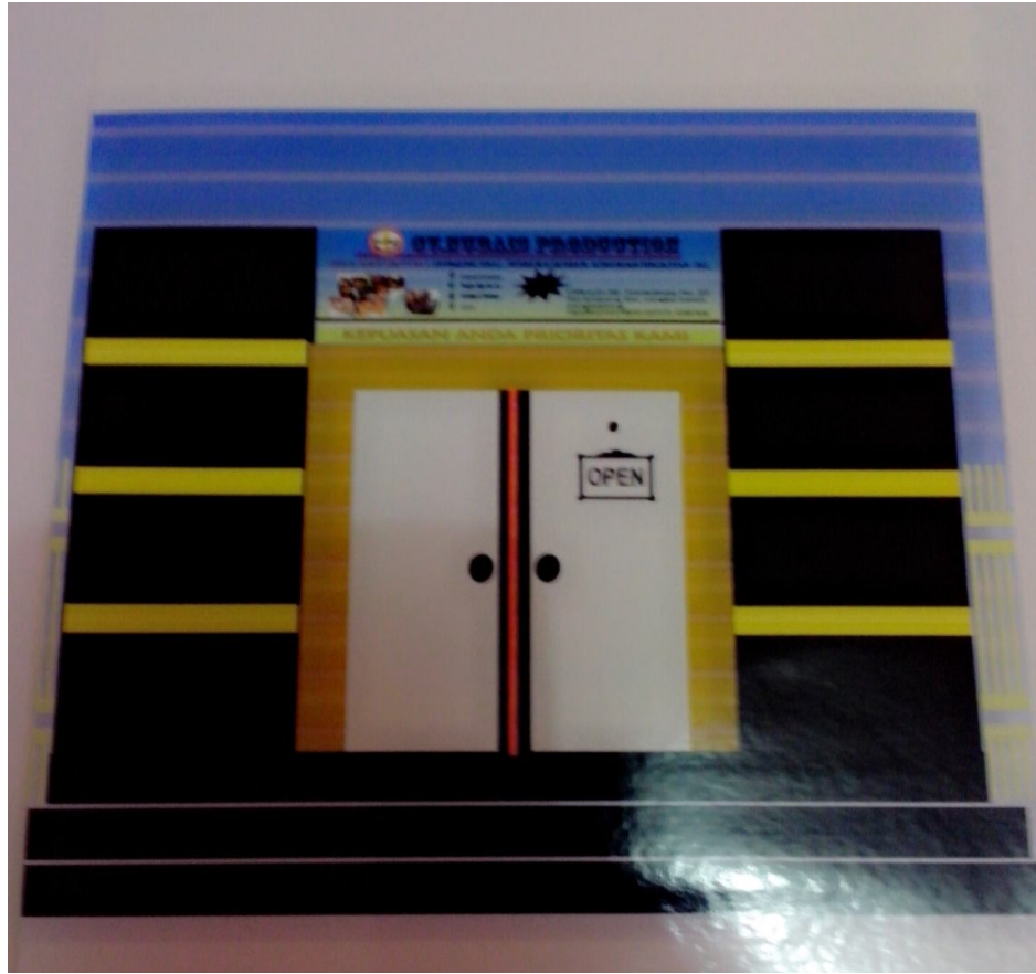
Lampiran A-11 Aoutlet