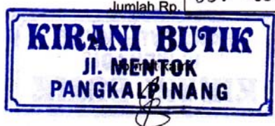
Lampiran A-1 Nota