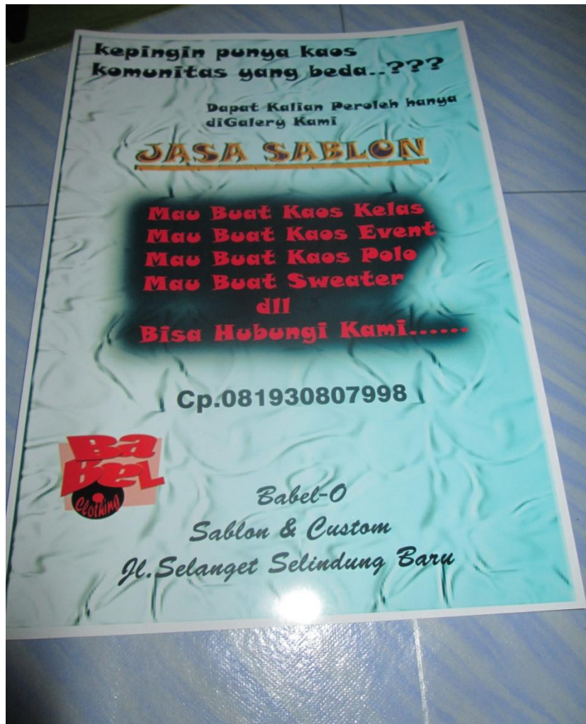
Lampiran A _ 4