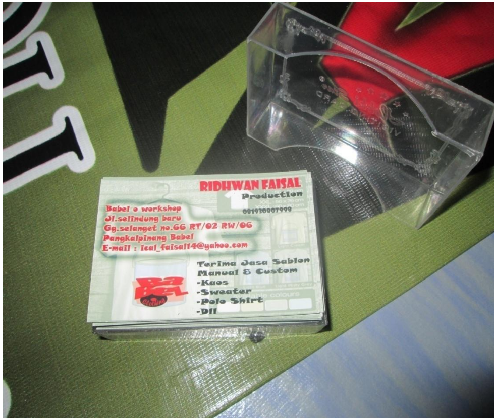
Lampiran A – 3