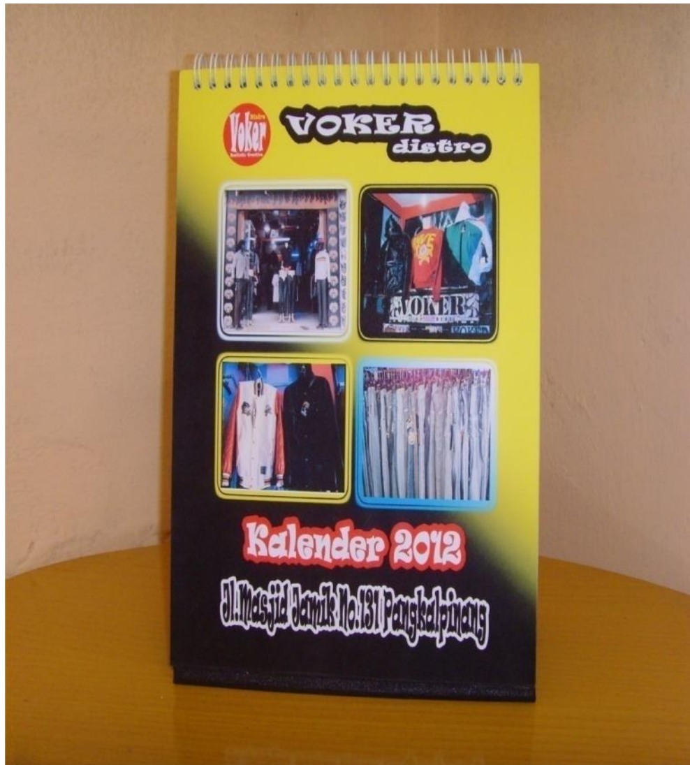
Lampiran A-8 Stationary Kalender