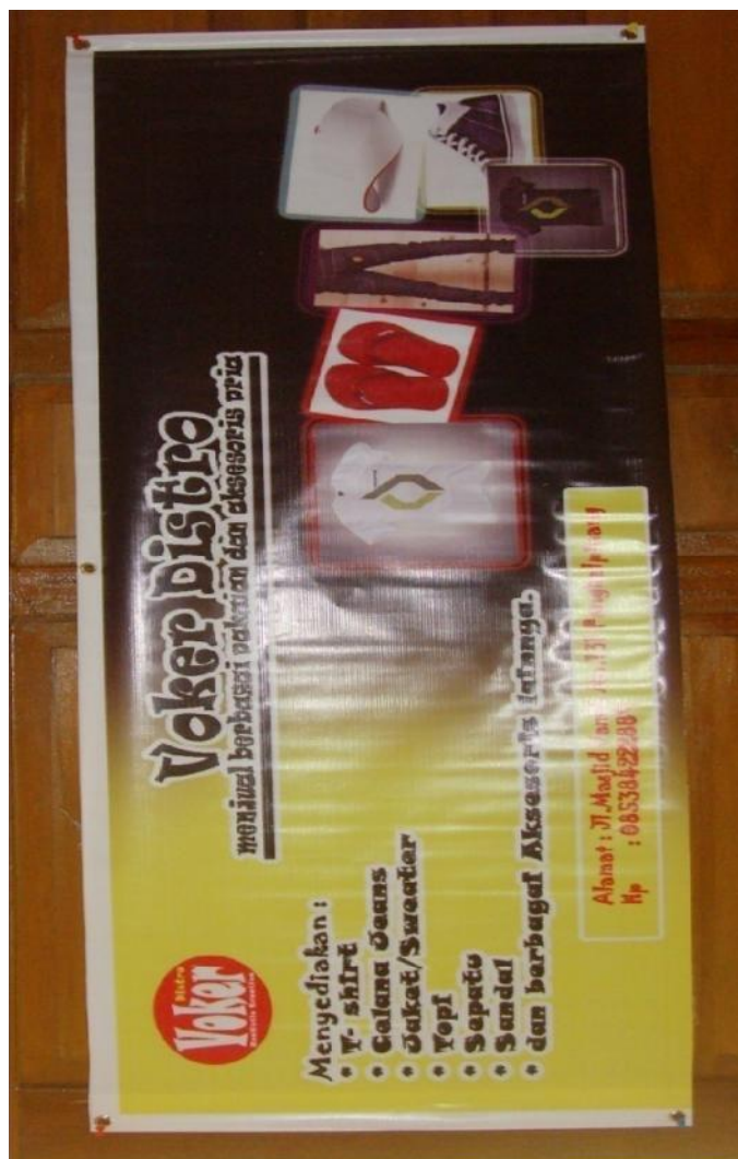
Lampiran A-6 Stationary Spanduk