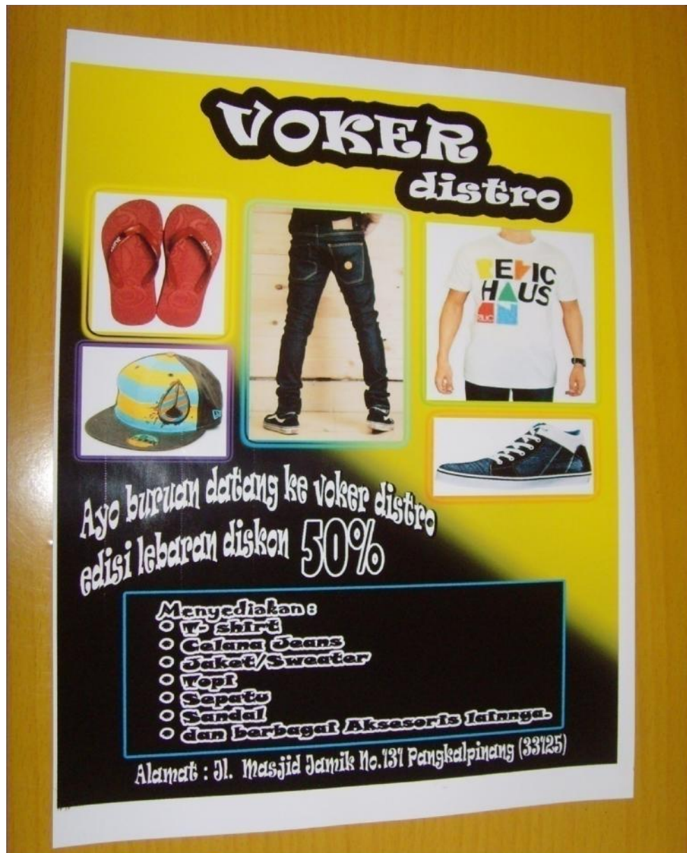
Lampiran A-9 Stationary Brosur