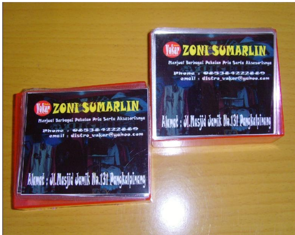
Lampiran A-4 Stationary Kartu Nama