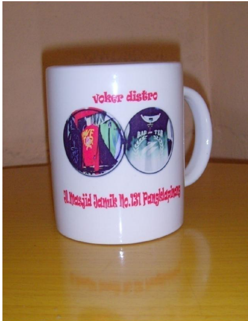
Lampiran A-3 Mug Voker Distro