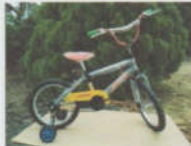
Babel Cycle 16 BMX Tipe A Rp. 675.000,00