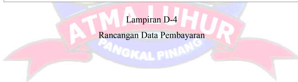
Lampiran D-4 Rancangan Data Pembayaran