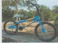
Babel Cycle 20 BMX Garuda Rp. 875.000,00