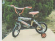
Babel Cycle 12 BMX Tipe A Rp. 650.000,00