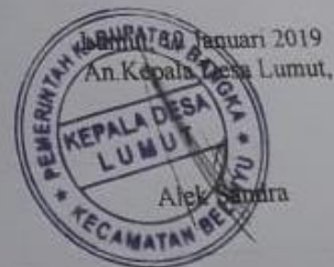
Lampiran E-6 Surat Keterangan Riset

Demikian Surat Keterangan ini dibuat dan diberikan kepada yang bersangkutan untuk dapat pergunakan sebagaimana mestinya.