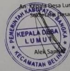
Lampiran B-1 Data Pegawai