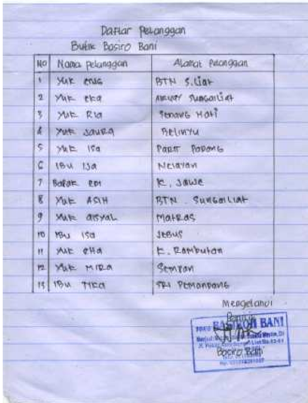
Lampiran B-2 Daftar Pelanggan