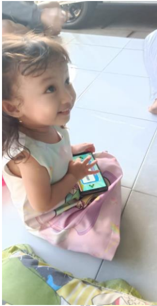
Foto Pengguna Aplikasi Guess Fruit