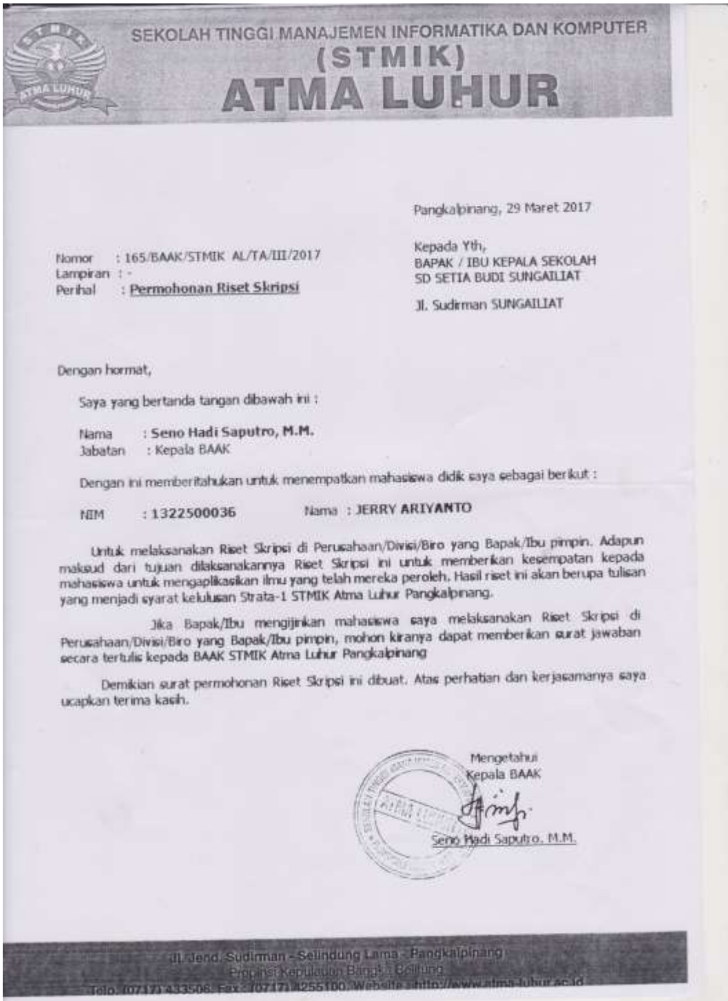
Lampiran E-1 Permohonan Riset Skripsi