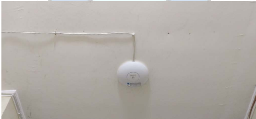
Access point Wireless Ubiquiti Unifi AP AC PRO