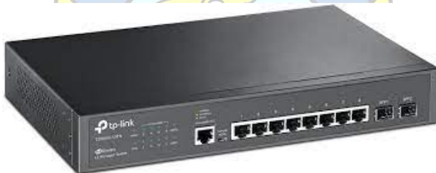
Switch tp-link T2500G-10TS (TL-SG3210)