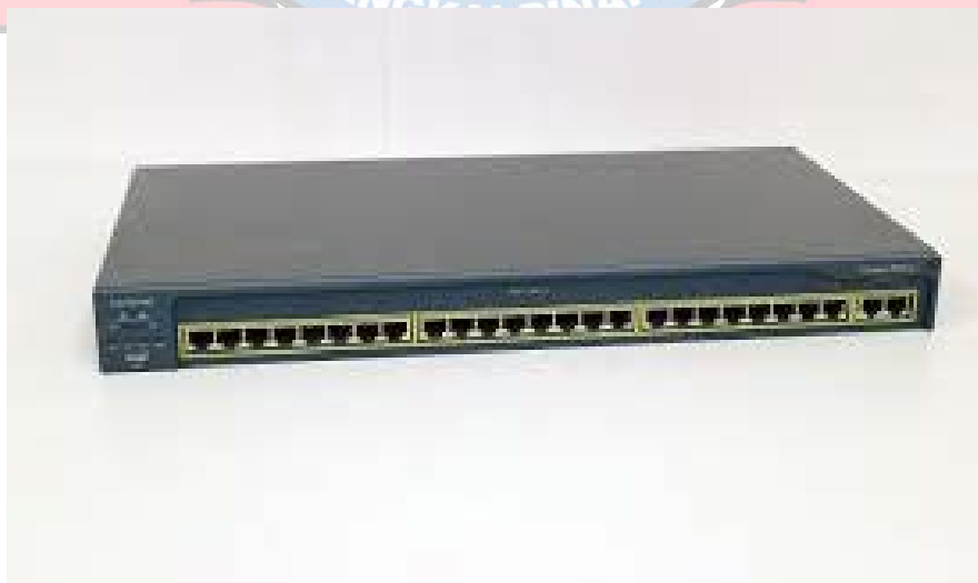
Switch Cisco Catalyst 2950