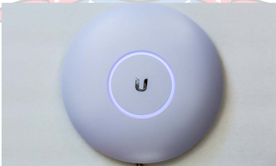
Access point Wireless Ubiquiti Unifi AP AC PRO