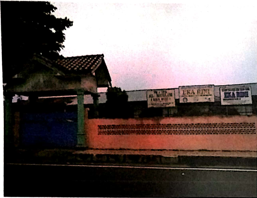
Gambar TK Eka Rini