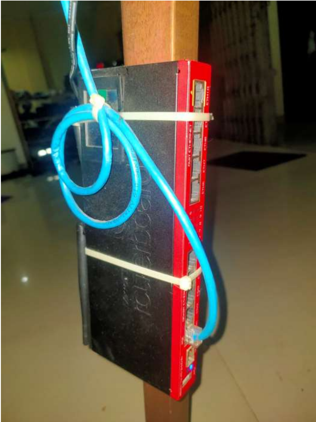
Gambar 4.36. Perangkat RouterBoard (Kantor)