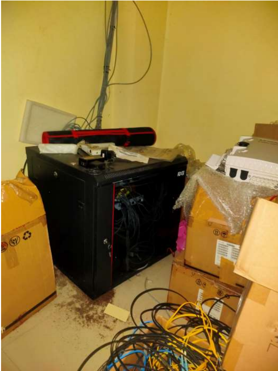
Gambar 4.39. Perangkat Box Server (Kantor)