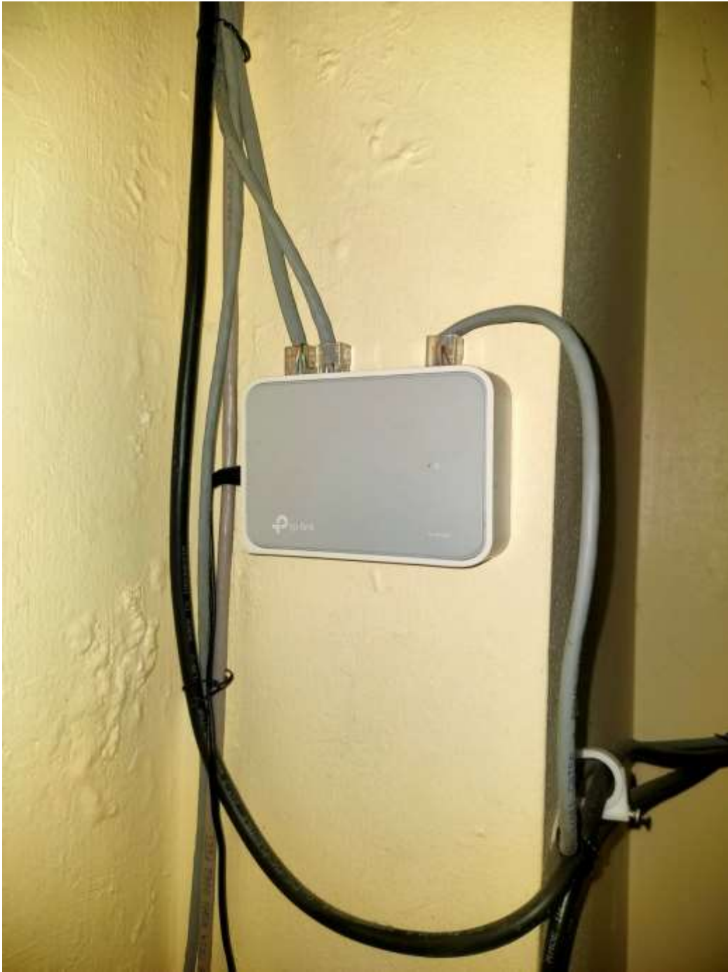
Gambar 4.37. Perangkat Switch (Kantor)