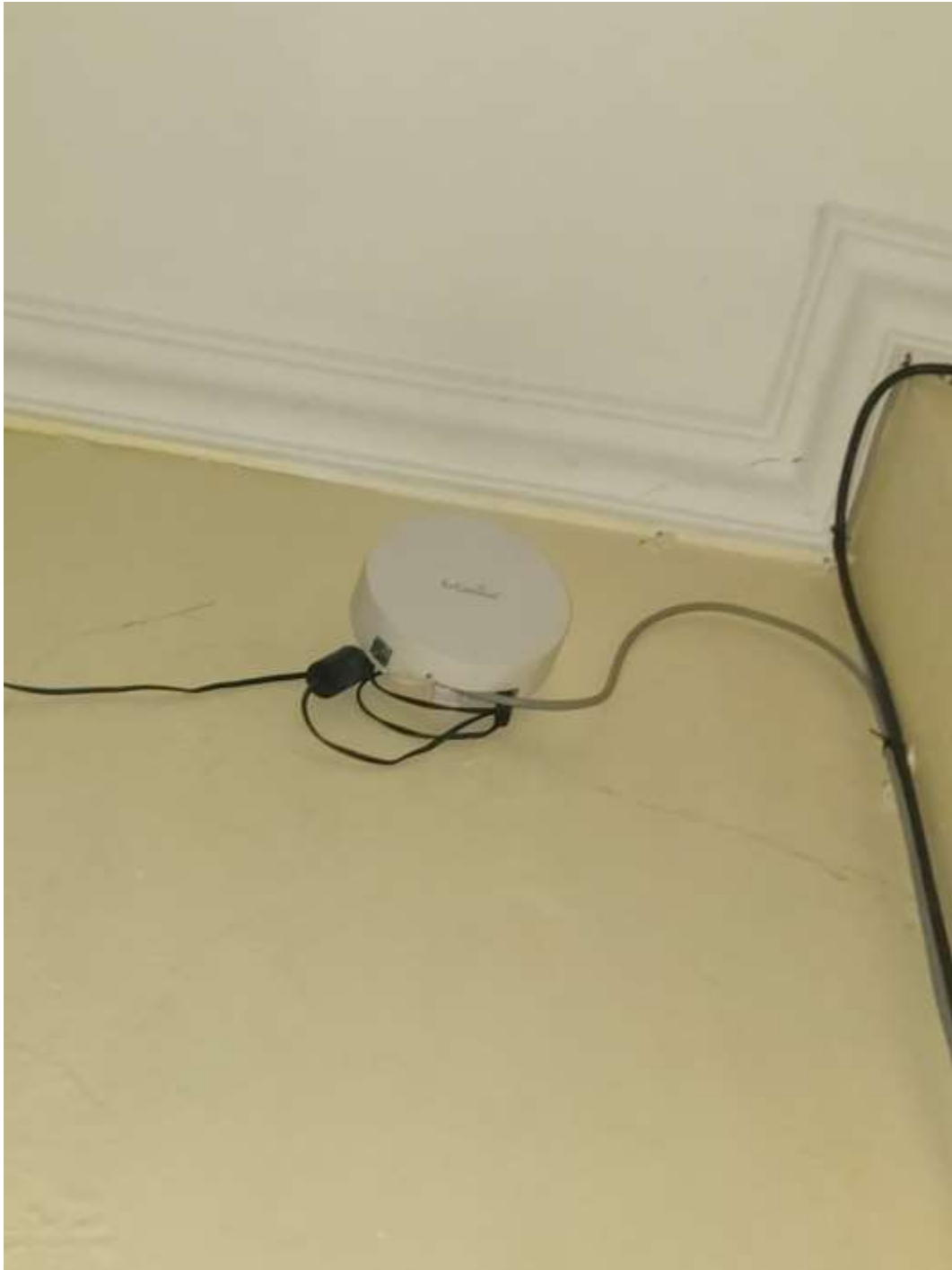
Gambar 4.38. Perangkat Access Point (Kantor)