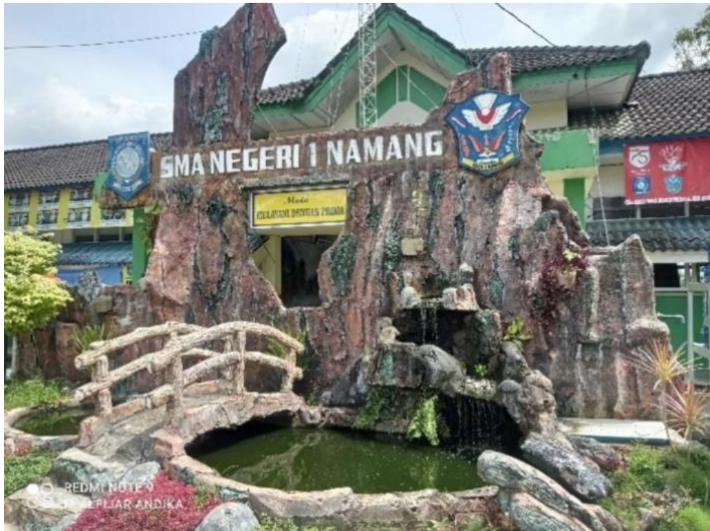
Lampiran 7 SMA Negeri 1 Namang