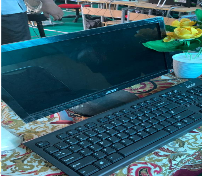
Lampiran 5 PC Server