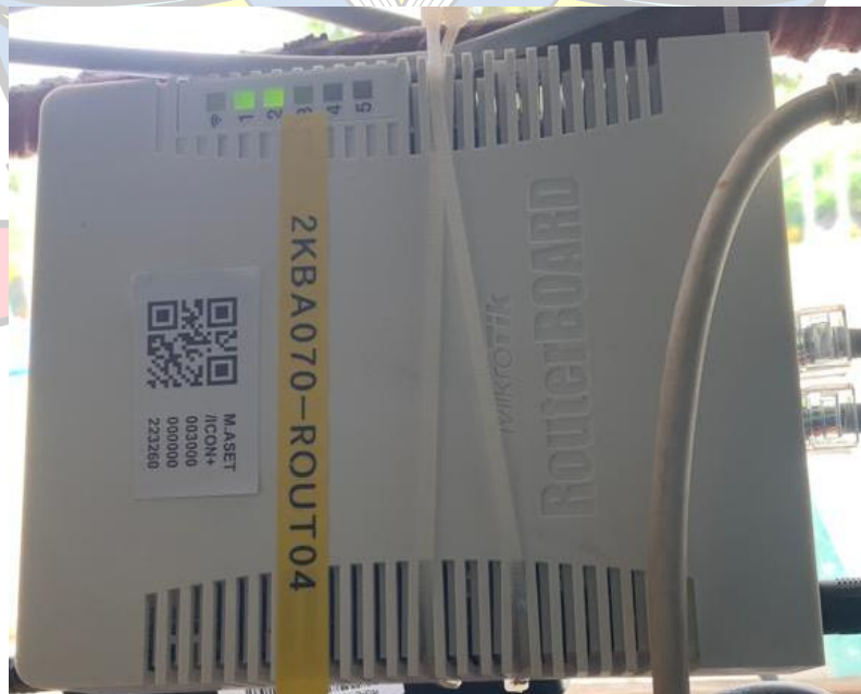
Lampiran 2 Mikrotik Routerboard Icon Plus