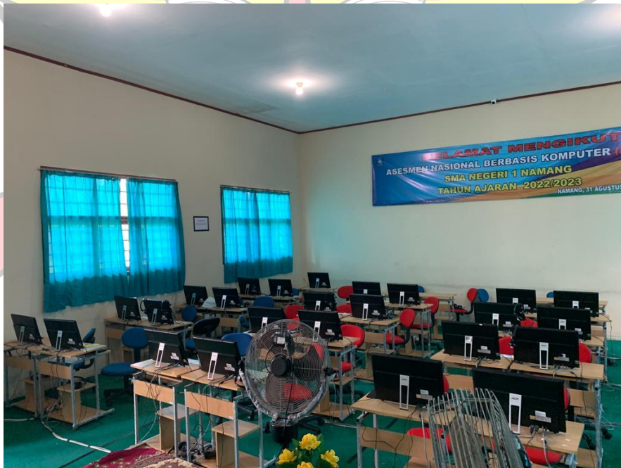
Lampiran 6 PC Client