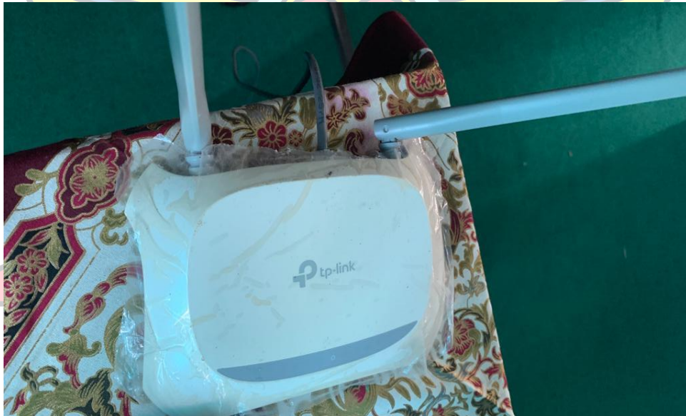
Lampiran 4 Router Wireless TL-WR840N