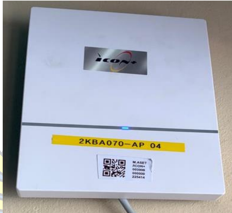
Lampiran 1 Modem Icon Plus