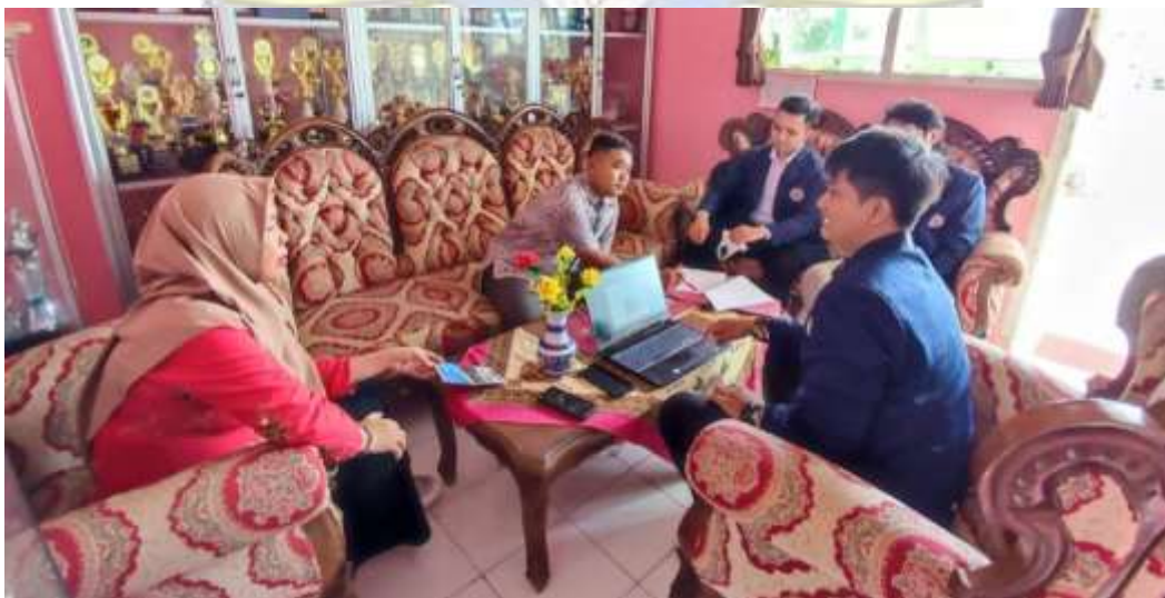
Lampiran 2 Wawancara dengan Wakasek Kurikulum dan Guru Mata Pelajaran (7 November 2022)