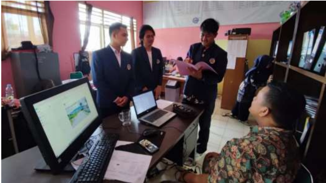
Lampiran 3 Wawancara dengan Staff Tata Usaha (9 Januari 2023)