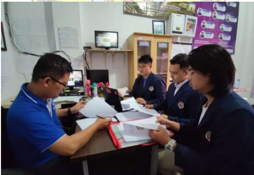
Lampiran 4 Bimbingan dengan Dosen Pembimbing (12 Januari 2023)