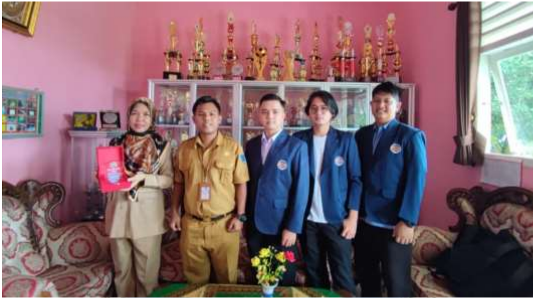
Lampiran 5 Perpisahan dari Tempat Kuliah Praktek (16 Januari 2023)