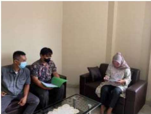
Dokumentasi Pengambilan Data 16 Desember 2022