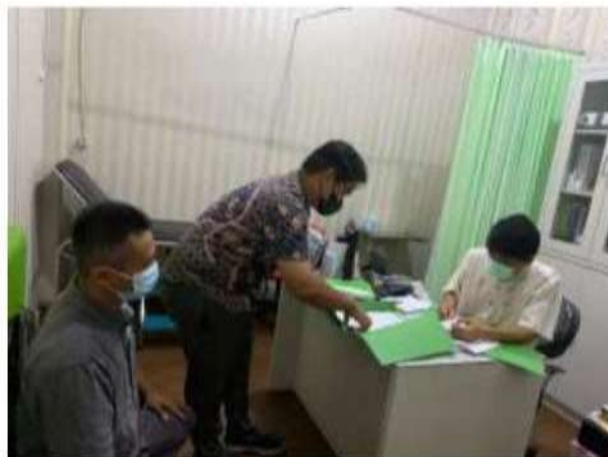
Pembahasan Hasil Laporan 28 Januari 2023