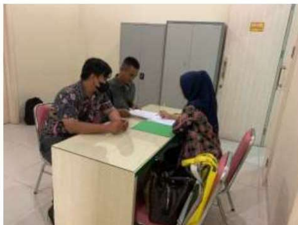
Dokumentasi Dengan Pembimbing Lapangan Kuliah Praktek 19 Desember 2022