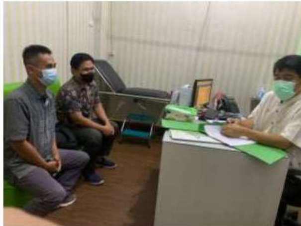
Dokumentasi Observasi Lapangan dengan Direktur RSIA Dzakirah 19 November 2022