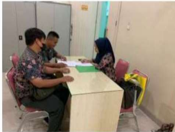
Dokumentasi dengan pembimbing lapangan 30 Desember