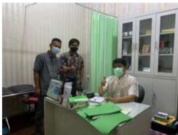
Foto Bersama Direktur RSIA Dzakirah Sekaligus Membahas Hasil Laporan 30 Januari 2023