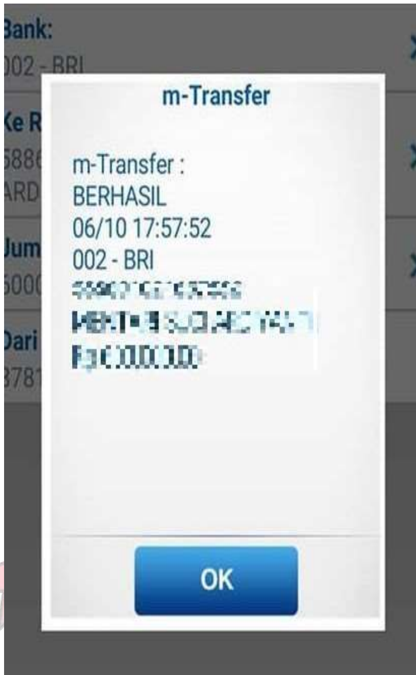
Lampiran B-4 Bukti Pembayaran