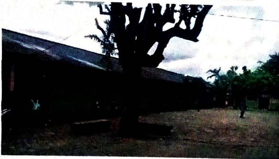
Lampiran B-6 Gallery Sekolah