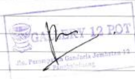
LAMPIRAN A-3 Laporan Pembelian