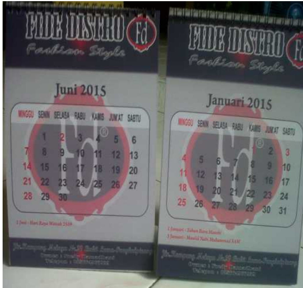
Hasil Cetak Kalender