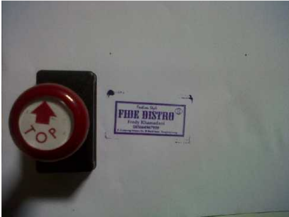
Hasil Cetak Stempel