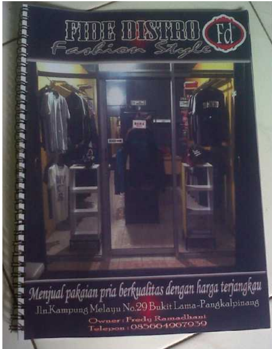
Hasil Cetak Katalog