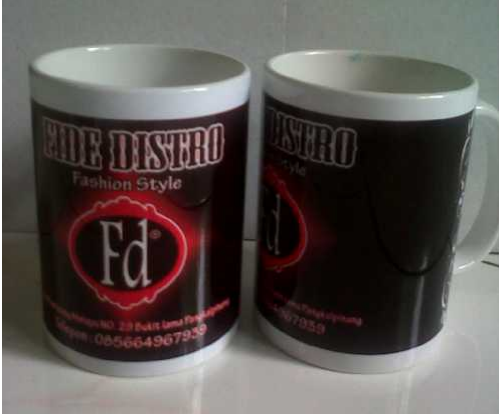
Hasil Cetak Mug