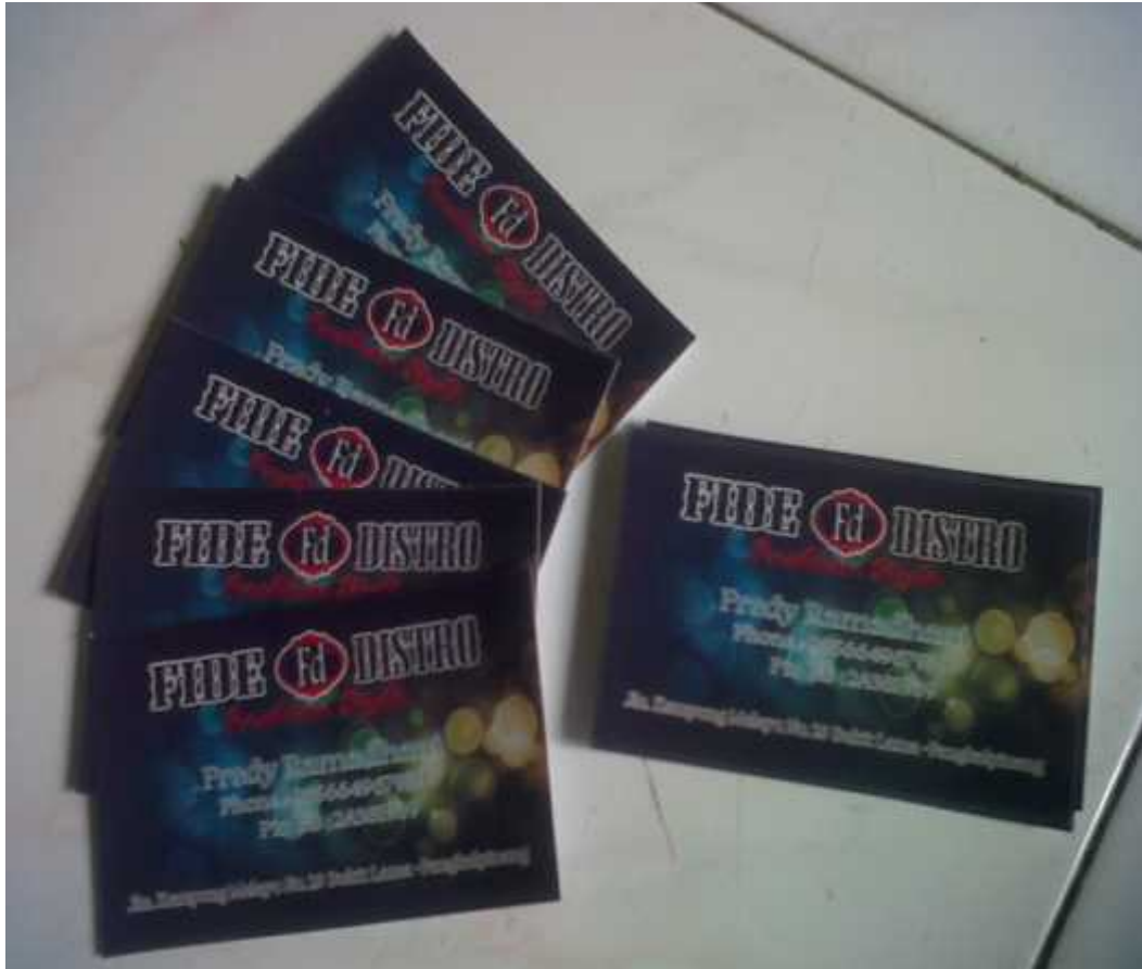
Hasil Cetak Kartu Nama