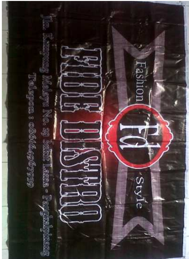
Hasil Cetak Spanduk