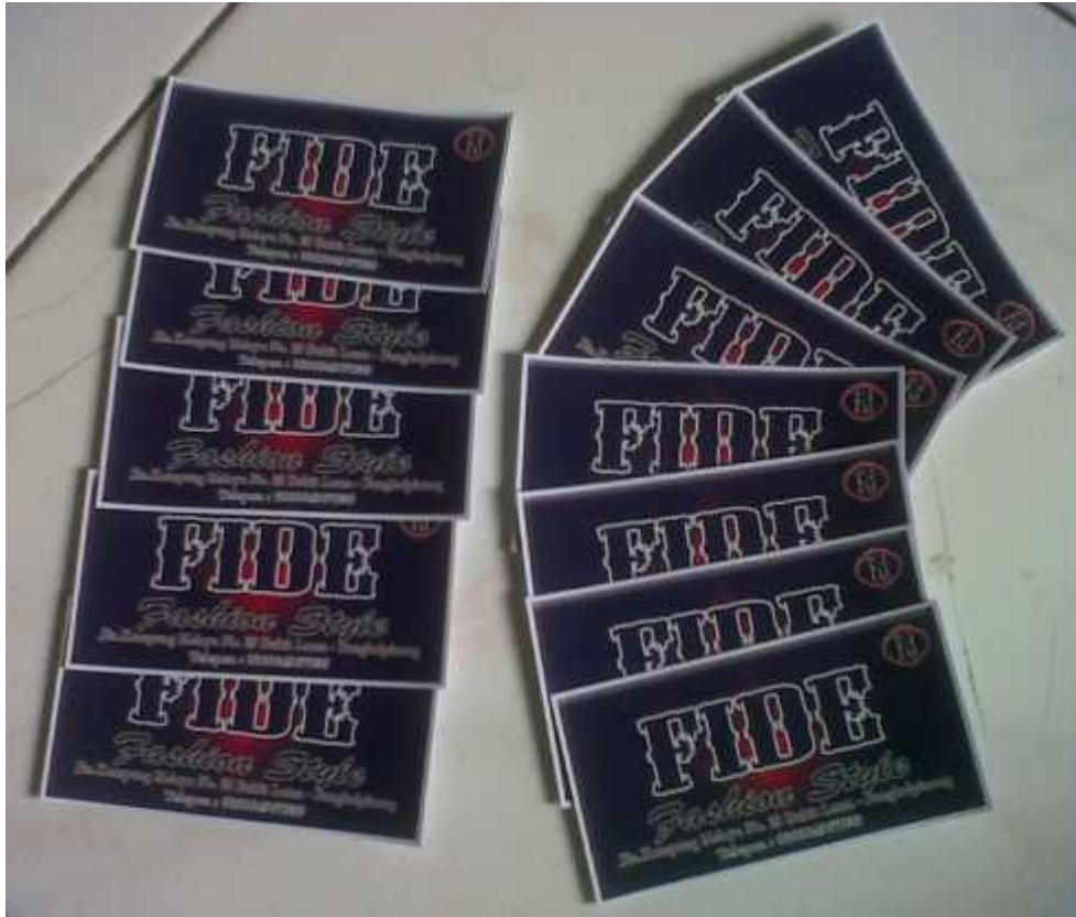
Hasil Cetak Stiker