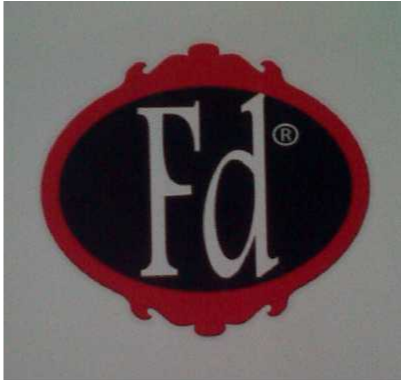
Hasil Cetak Logo