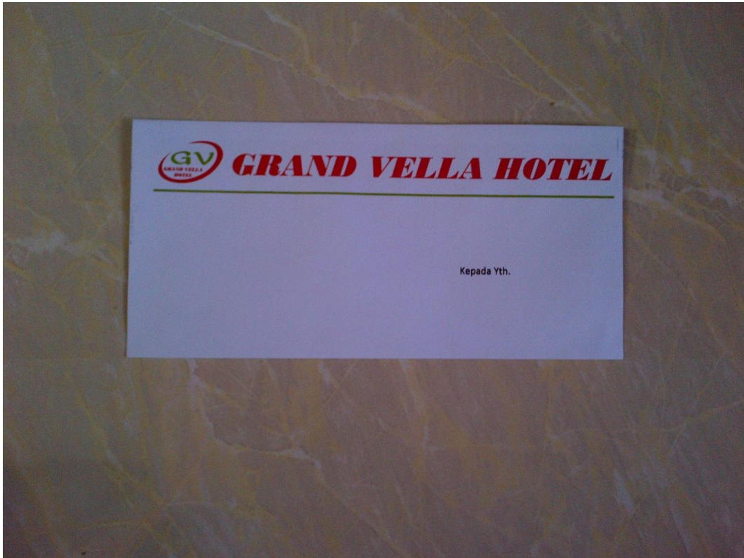
Lampiran A-7 Amplop