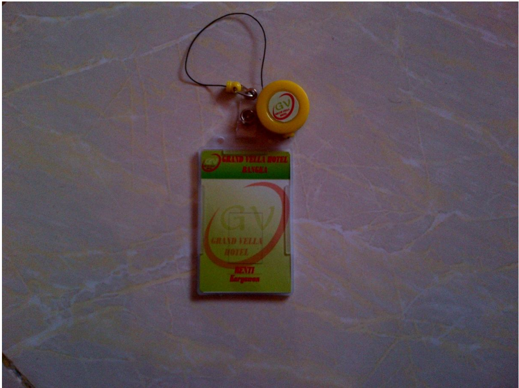
Lampiran A-5 Id Card