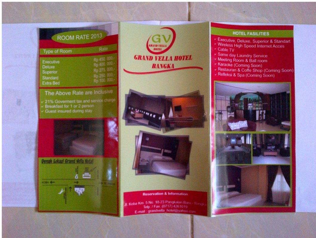
Lampiran A-2 Brosur