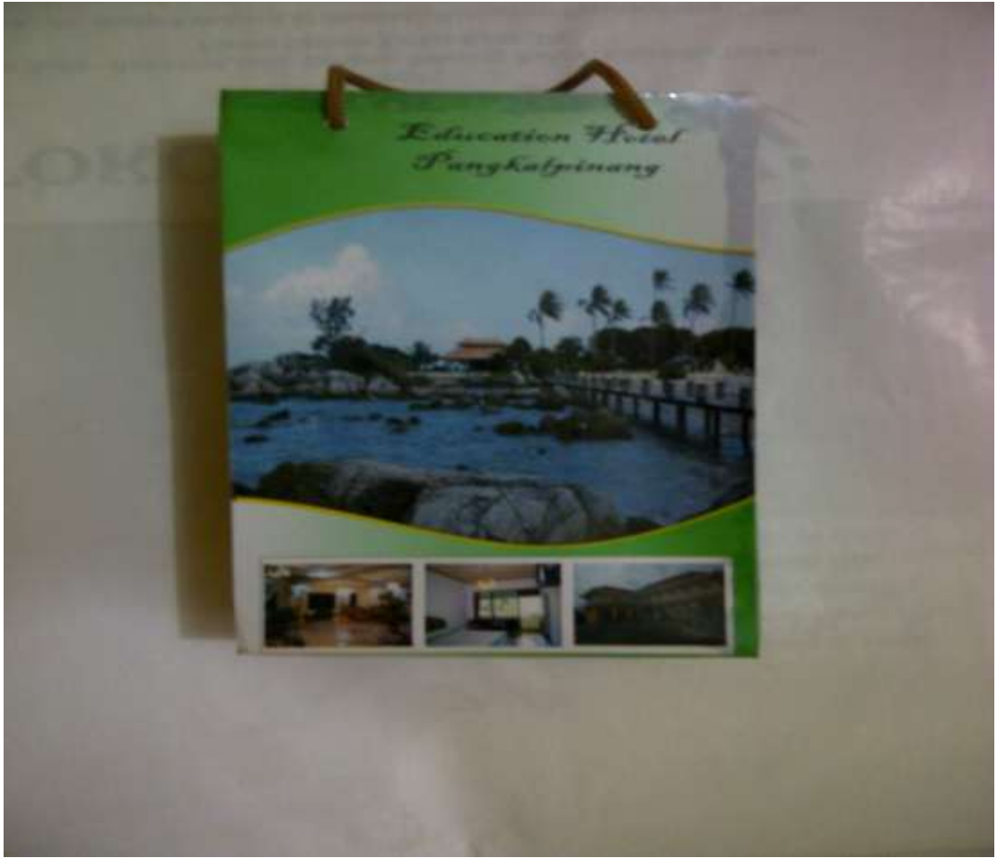
Lampiran A-7 Paper Bag