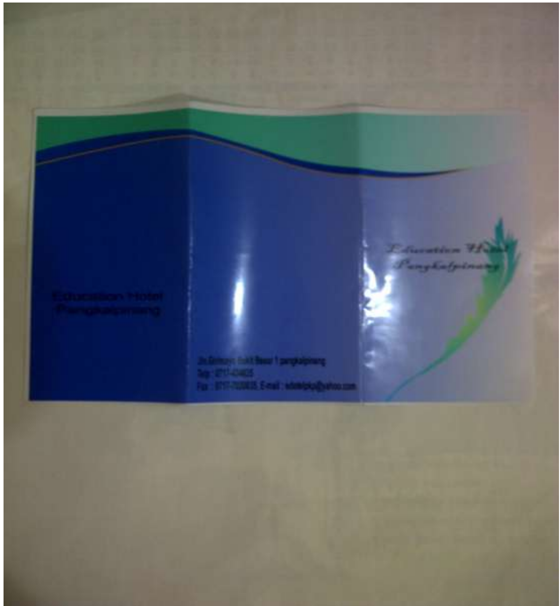
Lampiran A-2 Brosur