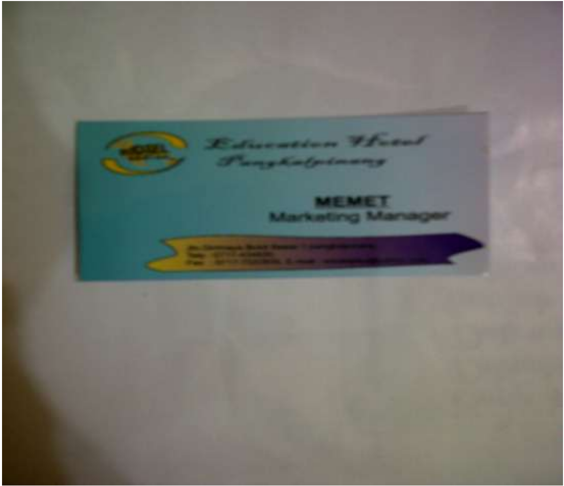
Lampiran A-4 Kartu Nama