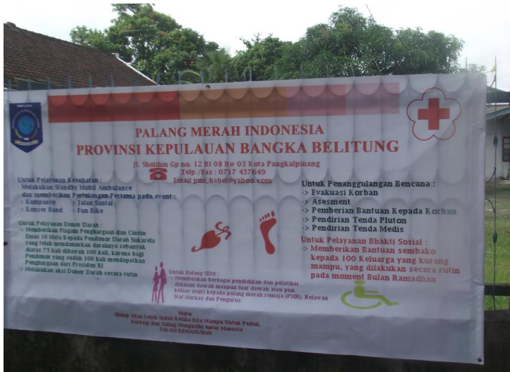
Lampiran Foto Spanduk