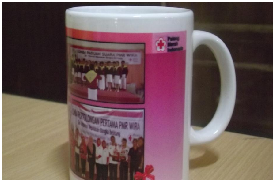
Lampiran Foto Mug