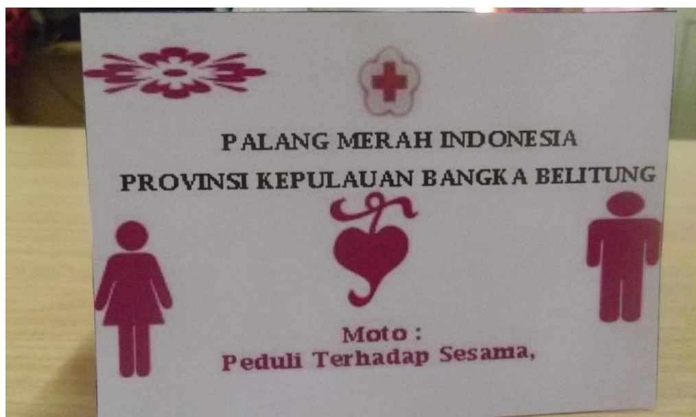
Lampiran Foto Stiker