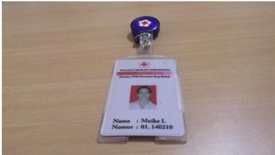
Lampiran Tag Name