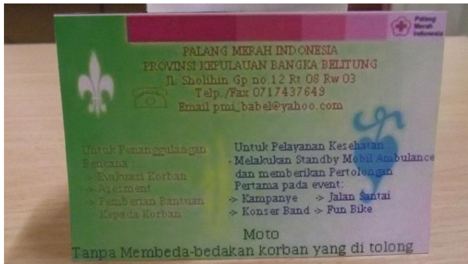
Lampiran Foto Kartu Nama