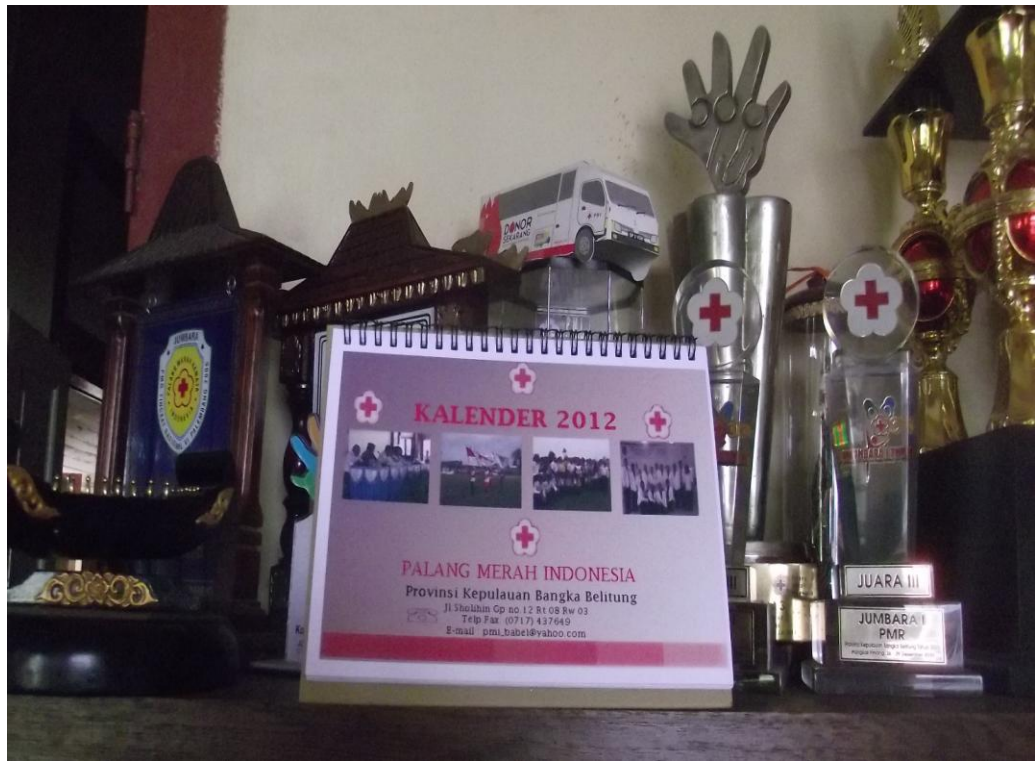
Lampiran Foto Kalender PMI Provinsi Kepulauan Bangka Belitung