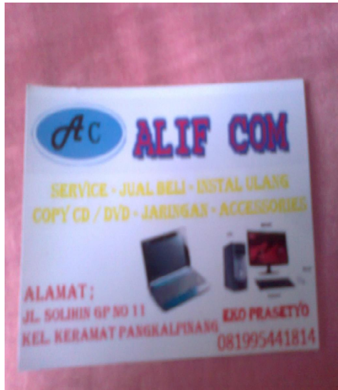
LAMPIRAN FOTO KARTU NAMA