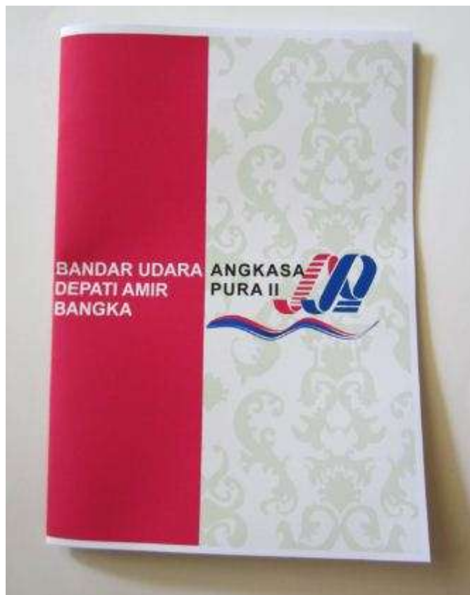
Lampiran A-1 Company Profile