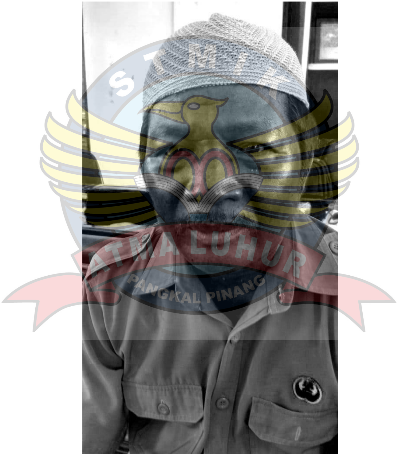
Lampiran 1 : Contoh Foto yang telah diproses