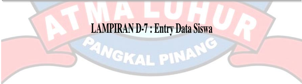
LAMPIRAN D-7 : Entry Data Siswa