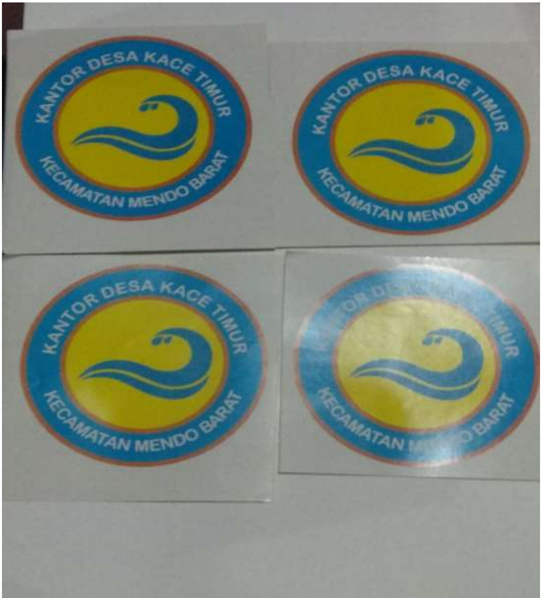
Lampiran A-1 Lembar Hasil Kerja Desain Logo