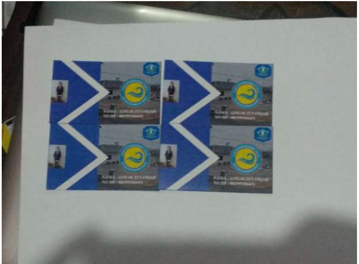
Lampiran A-2 Lembar Hasil Kerja Desain Kartu Nama