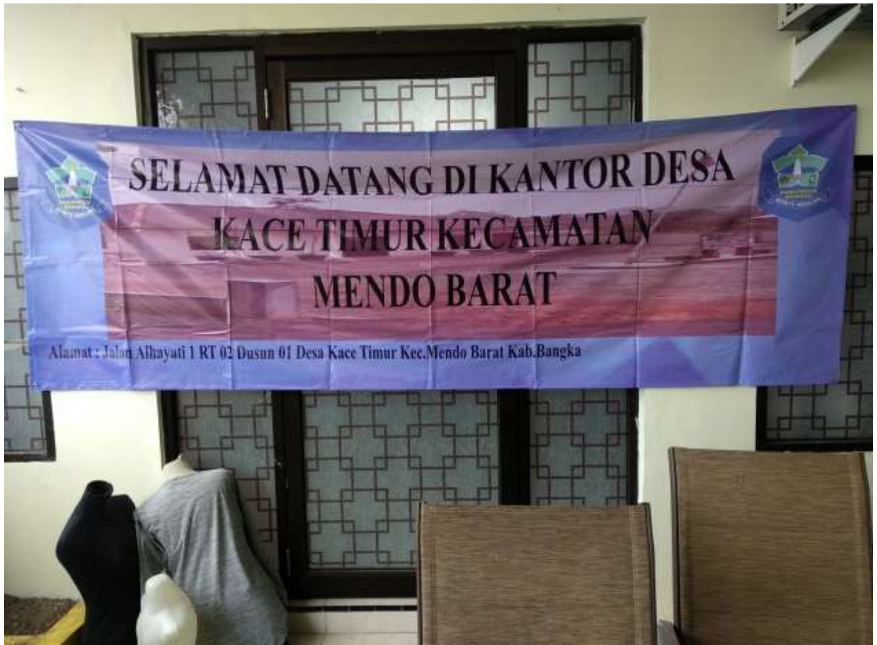
Lampiran A-3 Lembar Hasil Kerja Desain Spanduk