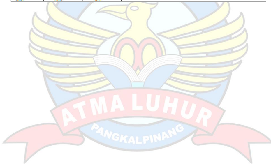
Lampiran C-1 Cetak Bukti Pembayaran Pembelian