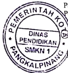
Fitriyani, M.Kom. NIDN. 20028501

Pangkalpinang, 09 Januari 2016 Pembimbing Lapangan,