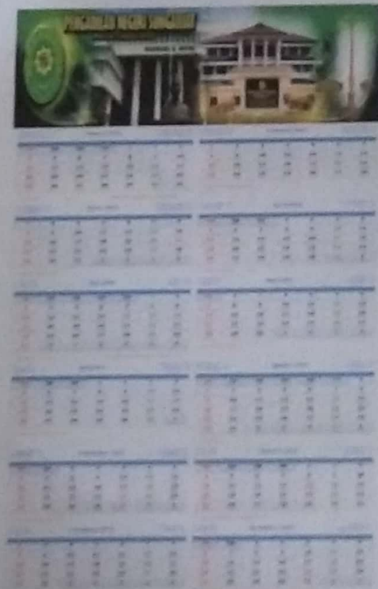
Gambar IV.2 : kalender