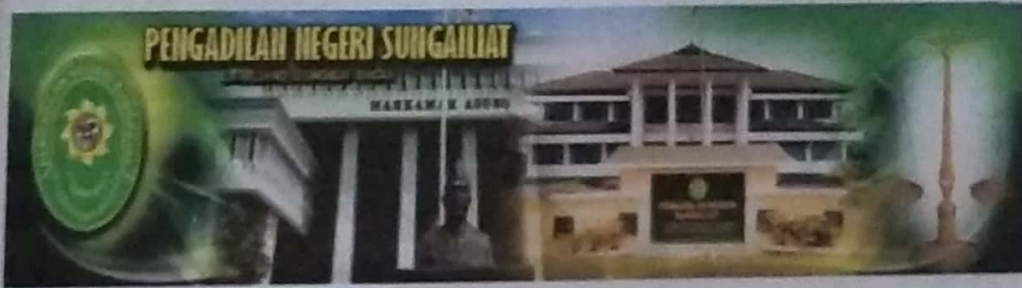
Gambar IV.1 : stiker