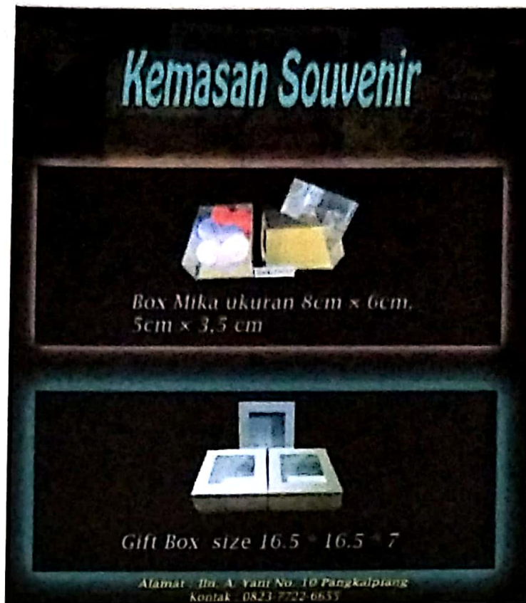
Gambar IV.9 Draft Katalog 2