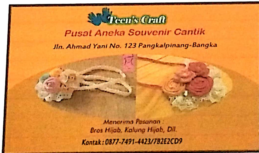
Gambar IV.2 Draft Kartu Nama Pelaku IKM