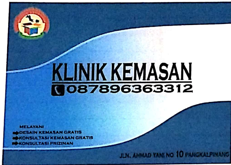
Gambar IV.1 Draft Kartu Nama Klinik Kemasan