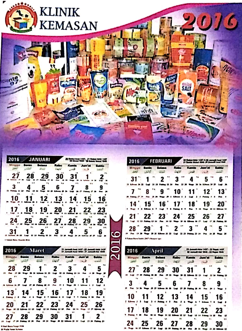
Gambar IV.4 Draft Kalender 1