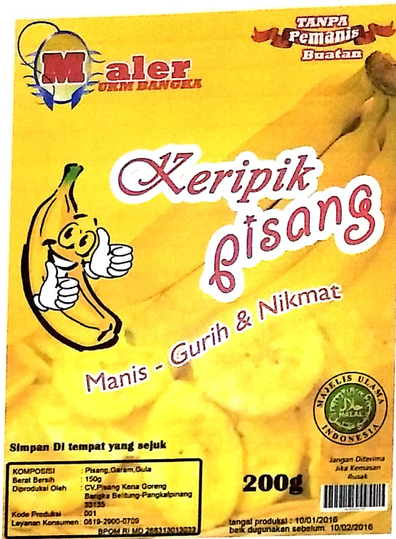
Gambar IV.11 Draft Label Kemasan Makanan