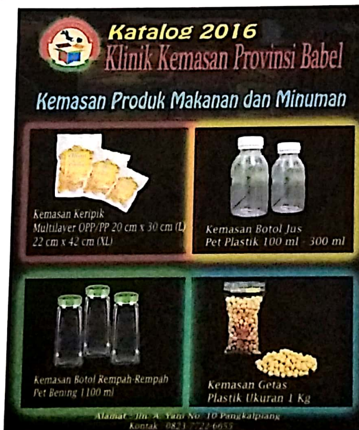
Gambar IV.8 Draft Katalog 1