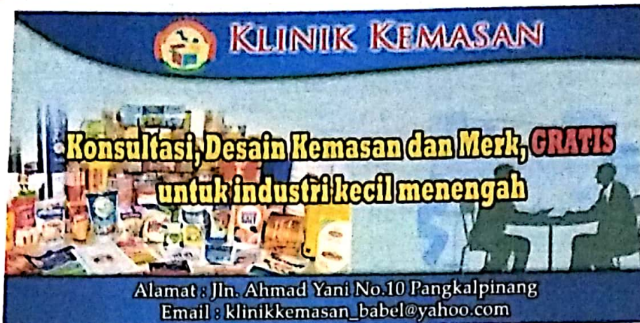
Gambar IV.7 Draft Spanduk