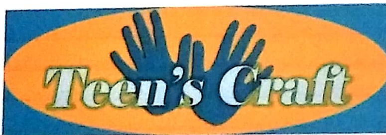
Gambar IV.12 Draft Stiker Souvenir