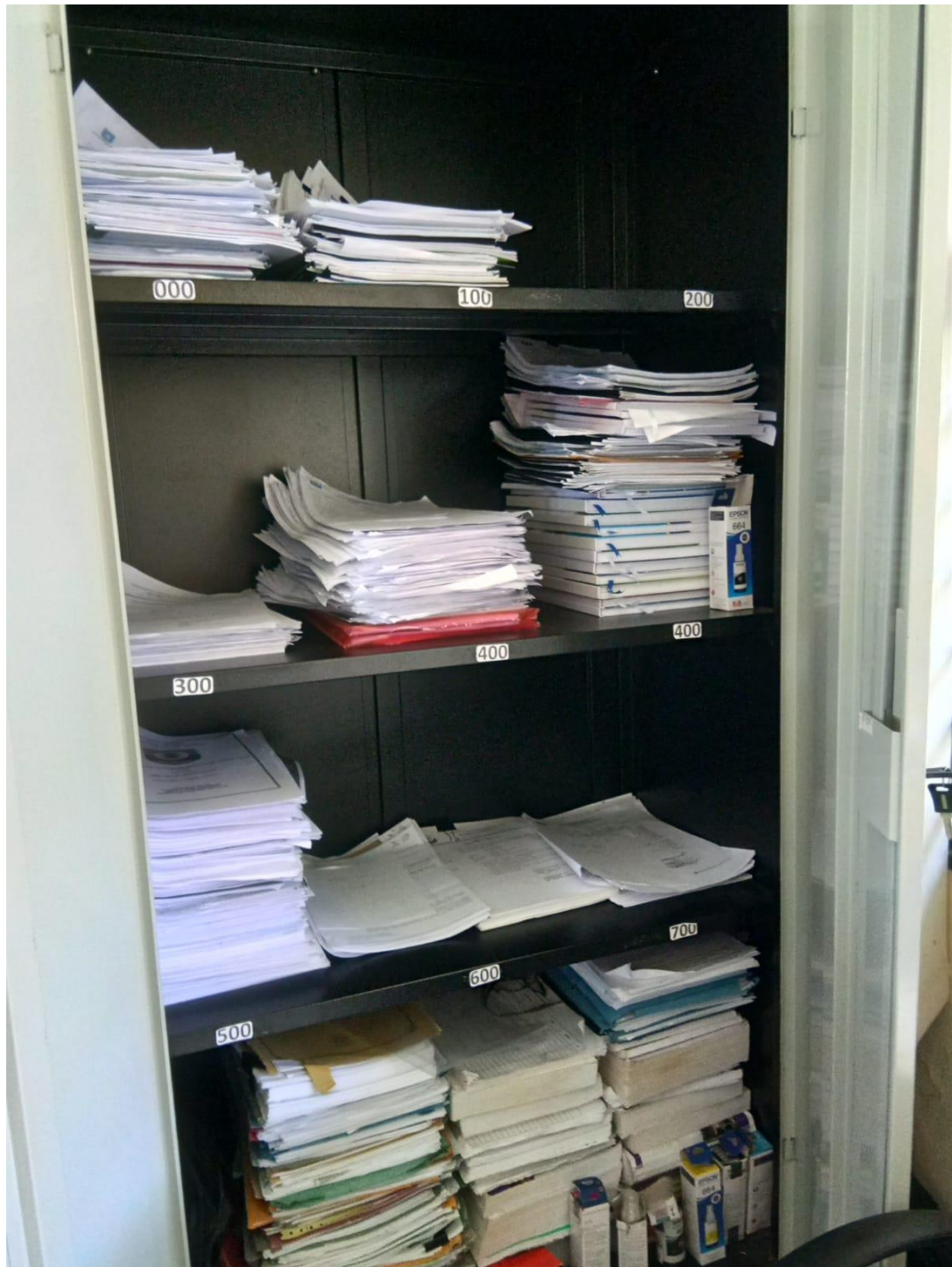
Lampiran E-1 Lemari Penyimpanan Arsip