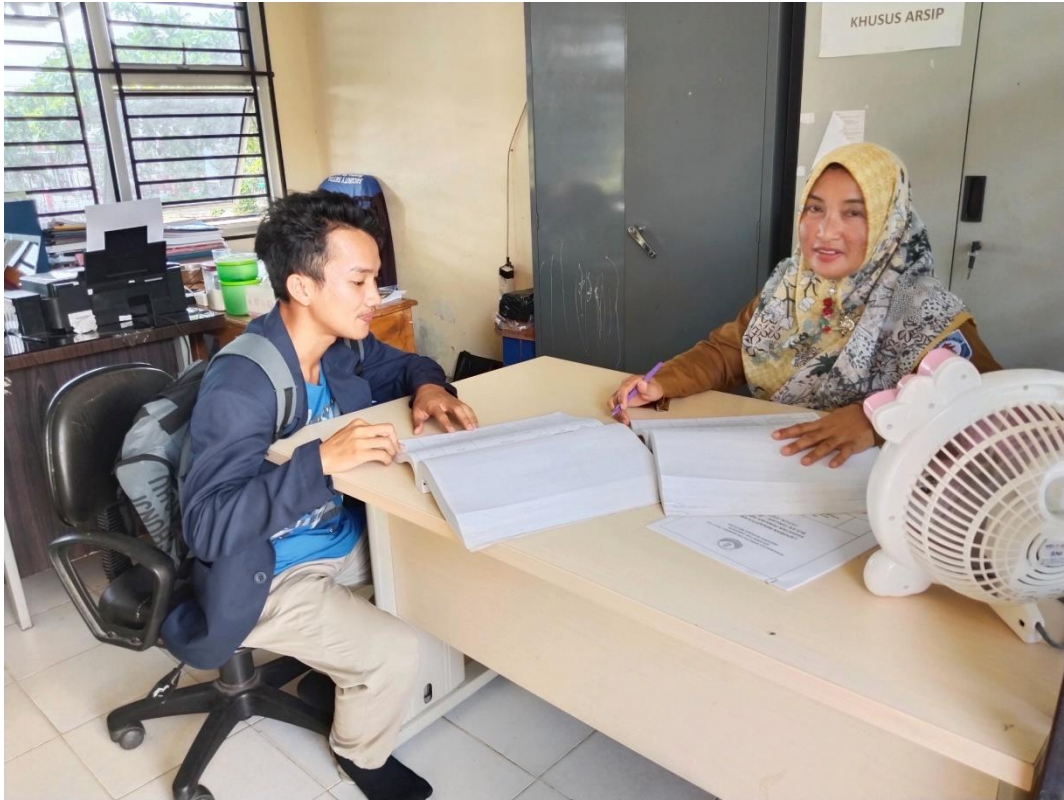
Lampiran E-2 Proses Wawancara