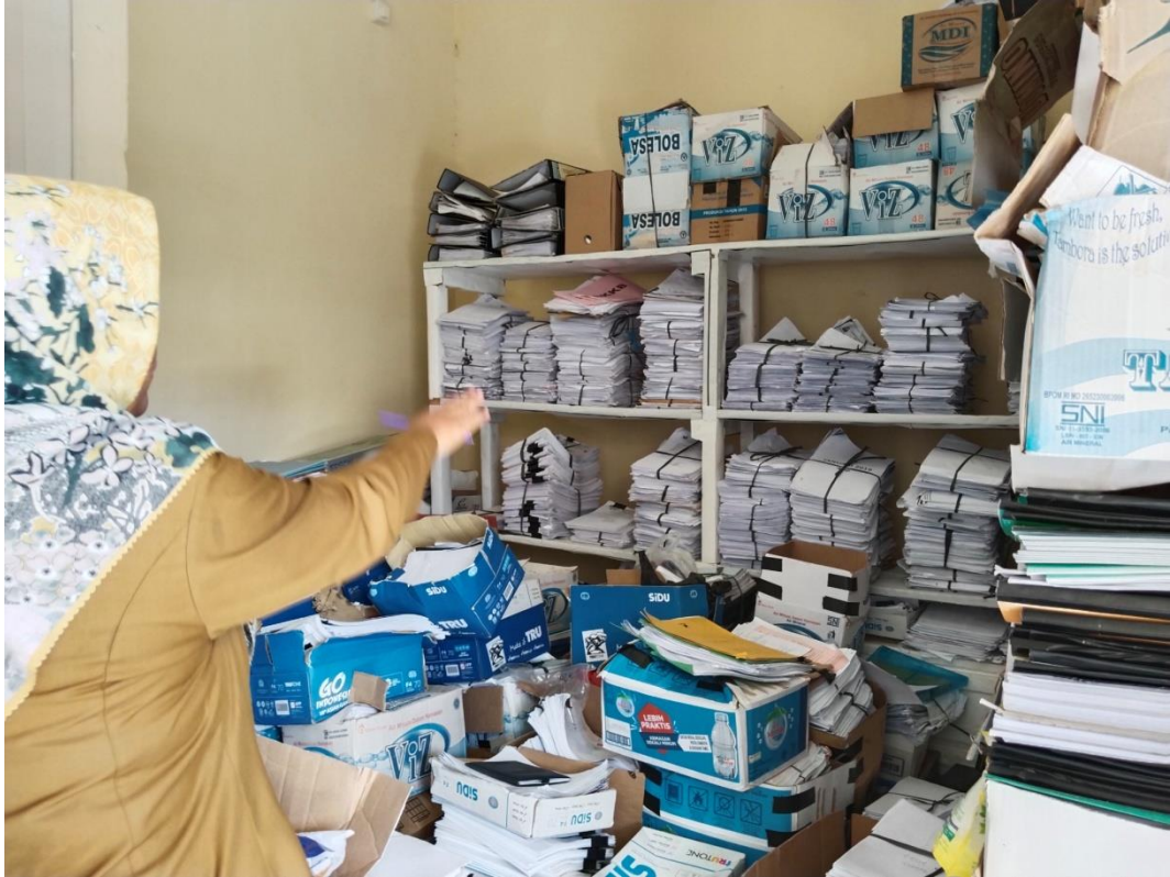
Lampiran E-3 Gudang Penampungan Arsip