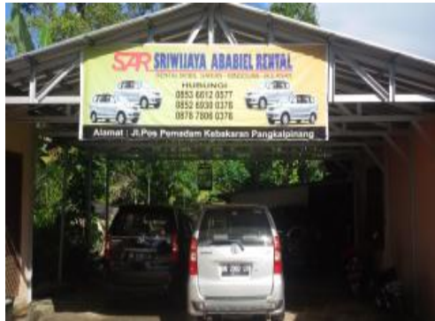
Sriwijaya Ababel Rental (SAR)