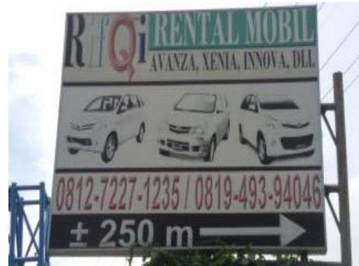
Rifqi Rental Mobil