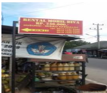
Rental Mobil Diva