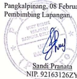
Sandi Pranata NIP. 92163126ZY

Pangkalpinang, 08 Februari 2024 Pembimbing Lapangan,