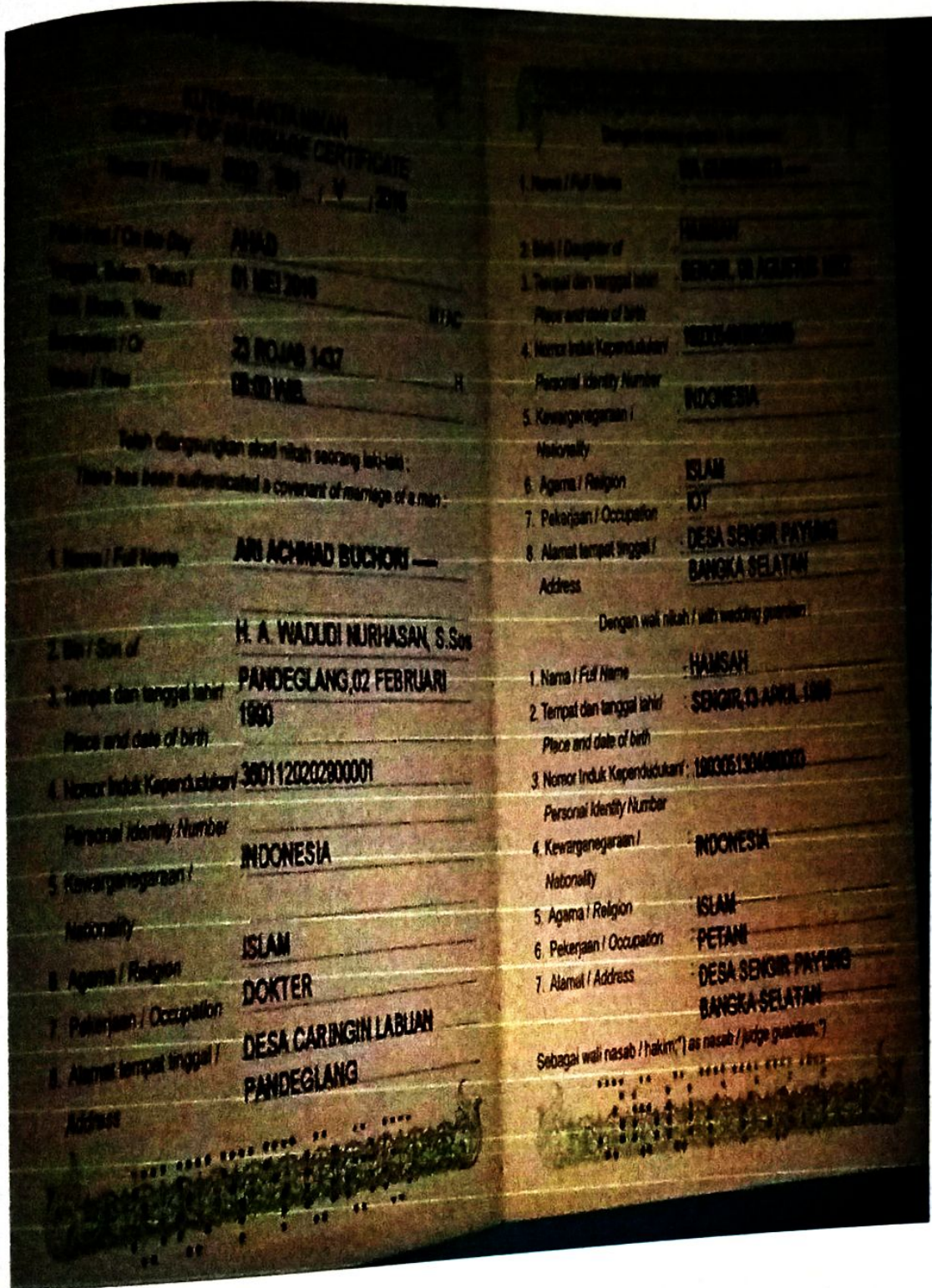
LAMPIRAN A-4 KUTIPAN AKTA NIKAH/BUKU NIKAH