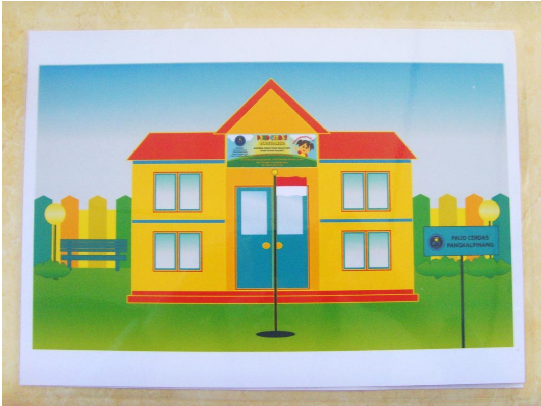
Lampiran A-10 Desain Gedung Sekolah