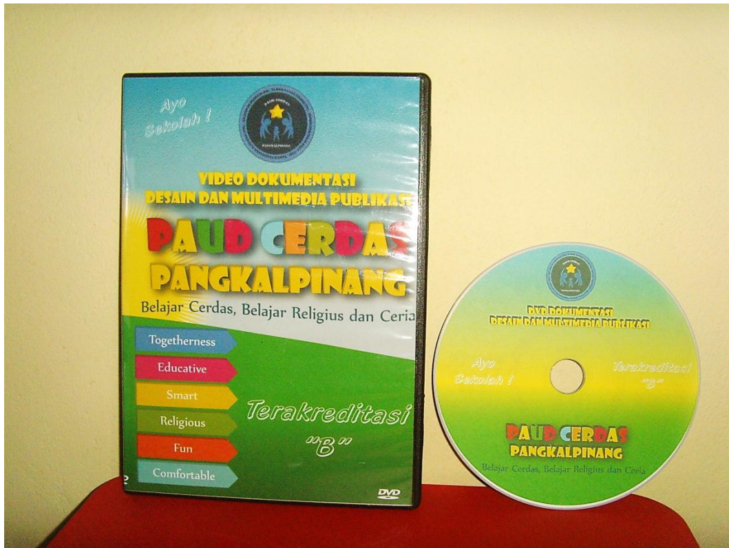
Lampiran A-11 DVD Dokumentasi