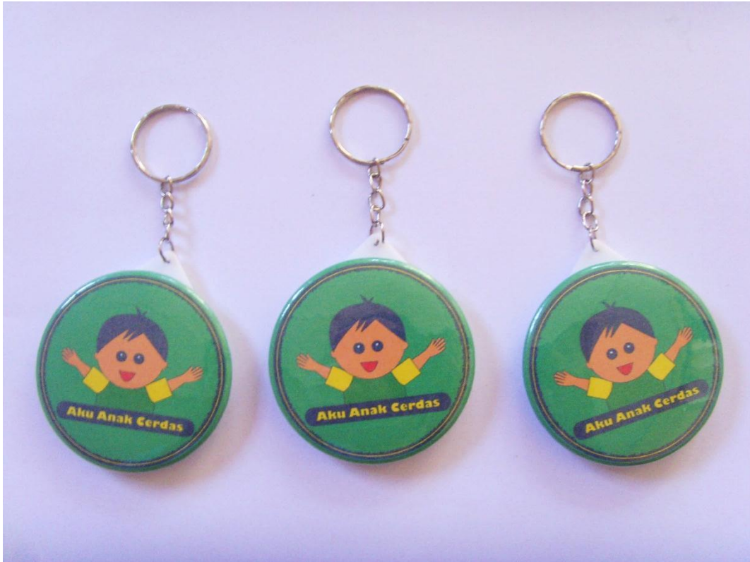
Lampiran A-8 Gantungan Kunci