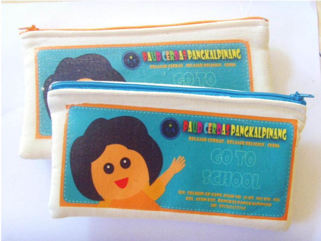
Lampiran A-9 Tempat Pensil